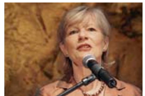
Zürcher Bildungsdirektorin Regine Aepli gratuliert den erfolgreichen Berufs-WM-Rückkehrern.