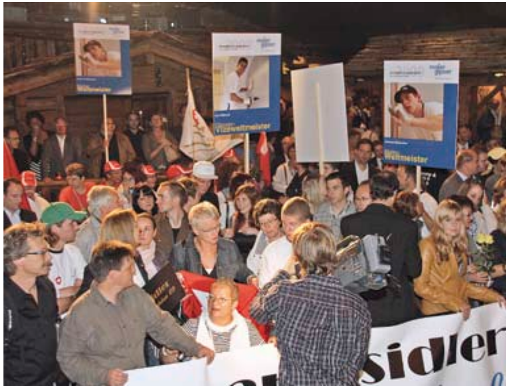
Grossartiger Empfang: Mit Plakaten, Transparenten und unter grossem Jubel wurde die Schweizer Delegation der Berufsweltmeisterschaften begrüsst.

ein, zwei Tränen in den Augen. Das Einlaufen der Mannschaften im traditionsreichen Stampede Park Stadion war, wie man es von Olympischen Spielen her kennt. Ein emotionaler Moment. Die Eltern waren da, der Schweizer Fanblock – es war super!»