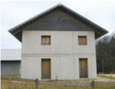
Exposition West, unbehandelte Stülpschalung, Alterung nach 62 Monaten: Die Verfärbung ist relativ gleichmässig.

gen insbesondere auch dann, wenn sie nach allen Windrichtungen hin exponiert wird, da sie auch in Westrichtung den Schutz des Holzes gewährleistet.