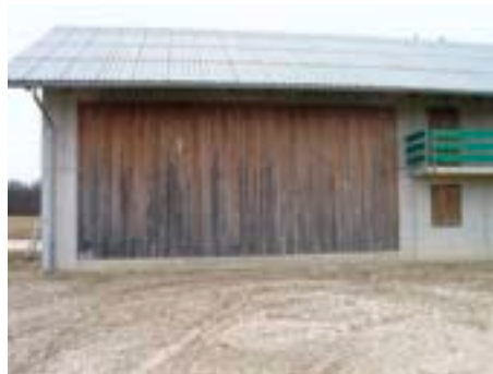
Exposition Nord, thermisch behandeltes Holz, Fichte, sägeroh, Alterung nach 64 Monaten: Starker Schimmelpilzbefall im unteren Bereich.

– Das thermisch behandelte Holz verändert sich ähnlich deutlich wie die unbehandelte Variante. Die Streuungen bei thermisch behandeltem Holz sind