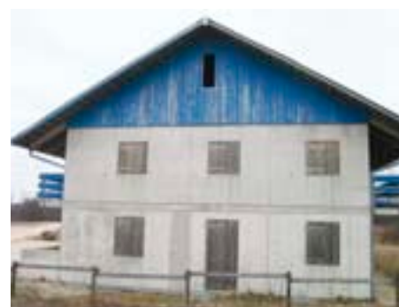
Exposition West, deckend blaue Beschichtung, Alterung nach 62 Monaten: Die Beschichtung ist bereits stark abgewittert, das Erscheinungsbild ist sehr ungleichmässig.

– Montageparameter : Art der Befestigung, Montagekosten und evtl. zusätzliche Kosten wie Abfälle, Transport, rostfreie Inox-Befestigungsmittel und Kleinmengenzuschlag. →