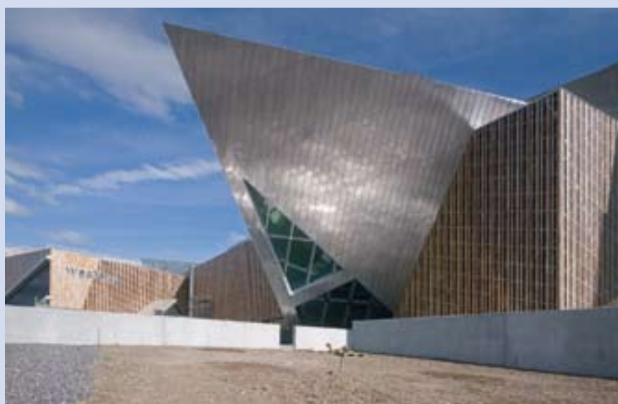
Westside, das neue Freizeit- und Einkaufszentrum in Bern-Brünnen. (Architekturfotograf: Alexander Gempeler)

Seifenbürsten-Masseurinnen und -Masseuren. Die Migros Aare ist die grösste Arbeitgeberin in Westside. Stellenangebote findet man unter www.westside.ch/jobs .