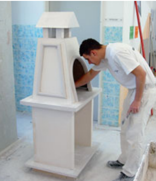
Das Gesellenstück: Der Gartengrill ist fertig. Der junge Gipser muss sich jetzt noch um die wichtigen kleinen Details kümmern.

Die Berner Malerlehrlinge haben es schon lange, die Berner Gipser erst seit kurzem: ein Gesellenstück. Bei der Anfertigung dieses Werkstücks sollen junge Berufsleute die besonderen Fähigkeiten unter Beweis stellen, die sie in der Ausbildung erworben haben. Die ersten Gipser-Gesellenstücke wurden nun aufgrund einer Initiative der Verbandssektion Bern Stadt im Januar 2008 im Ausbildungszentrum Worb angefertigt.