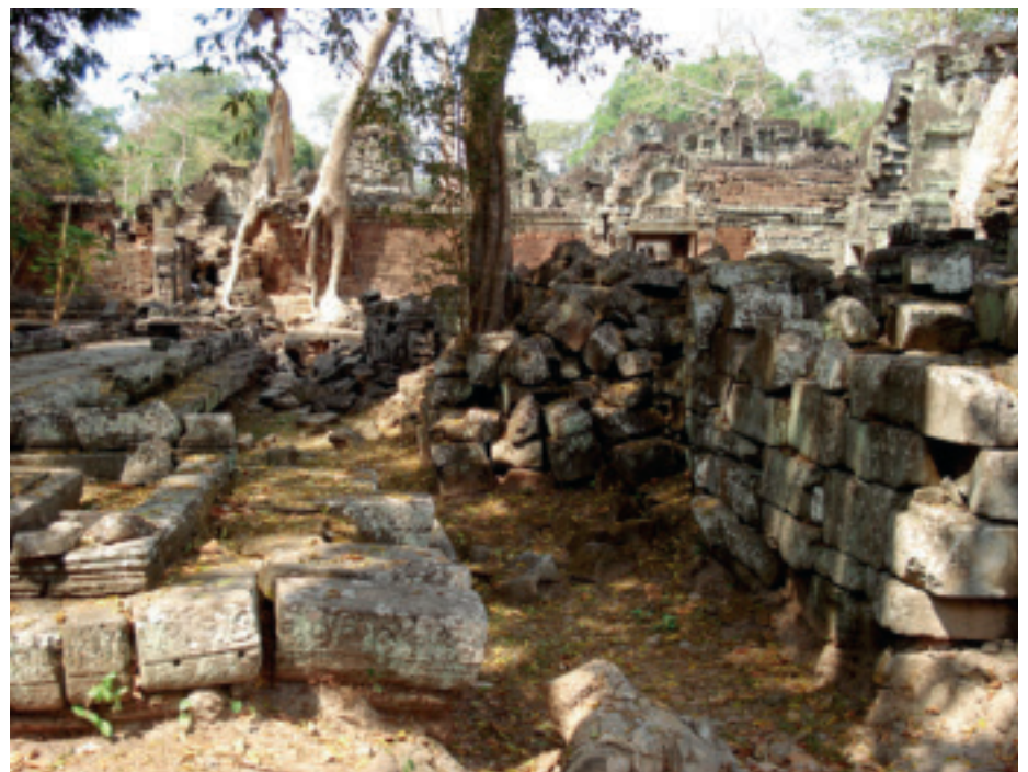
Der Dschungel hat sich über die Jahrhunderte seinen Weg durch die Tempelanlagen gebahnt.

Die kniende Frau ist eine der schönsten Bronzefiguren des Nationalmuseums in Phnom Penh. Auf Grund der erhobenen Arme und des Kopfschmuckes, der auf der ganzen Breite eine Einkerbung aufweist, wird sie als Spiegelhalter gedeutet.