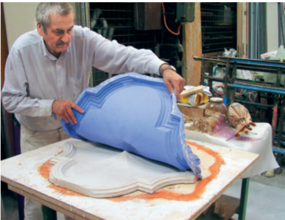
Fast wie am Fließband: Im Atelier der Salvini AG wurden die Duplikate für die Stuckdecke angefertigt.