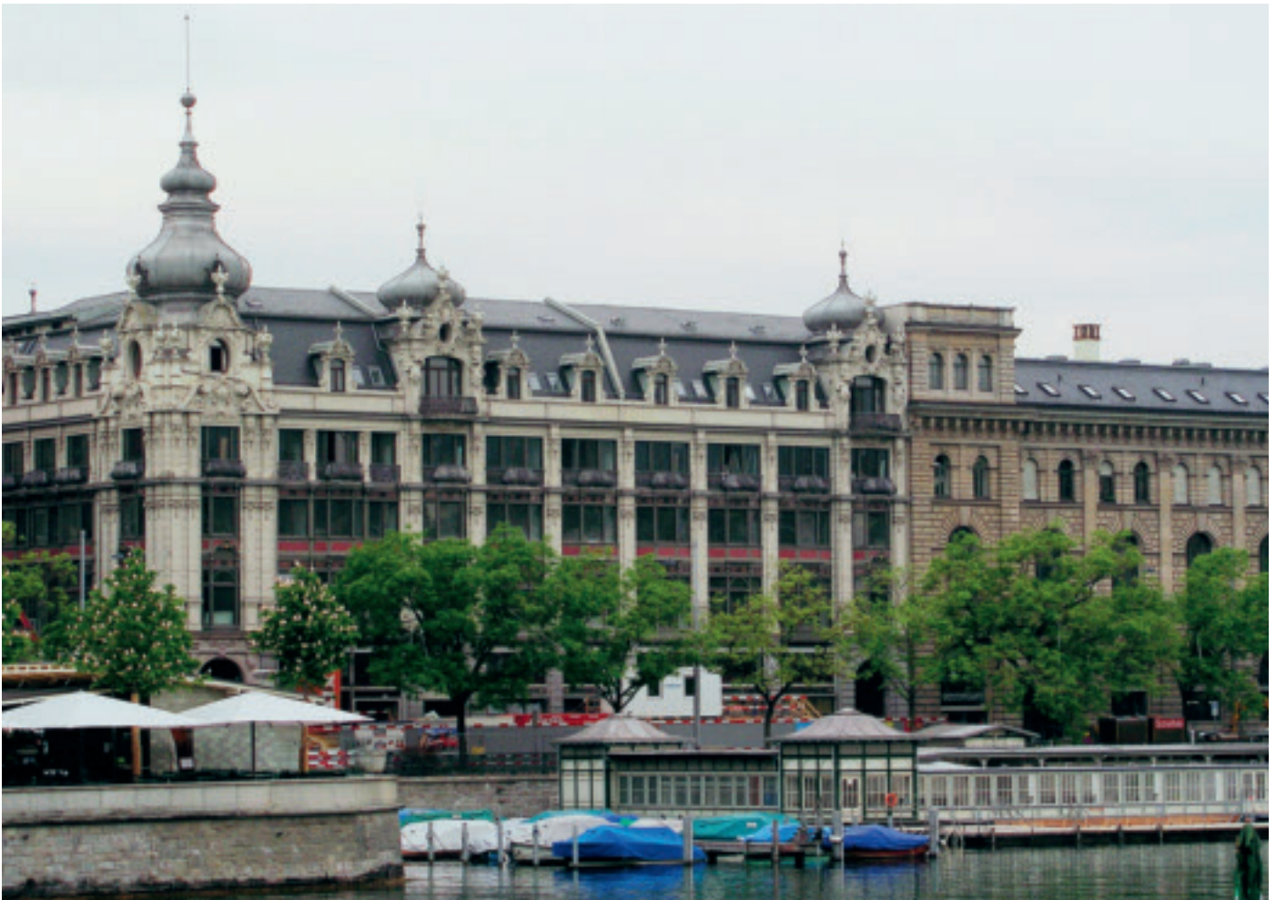
Das historische Metropol-Gebäude neben der Fraumünsterpost in Zürich wurde stilgerecht umgebaut und renoviert.