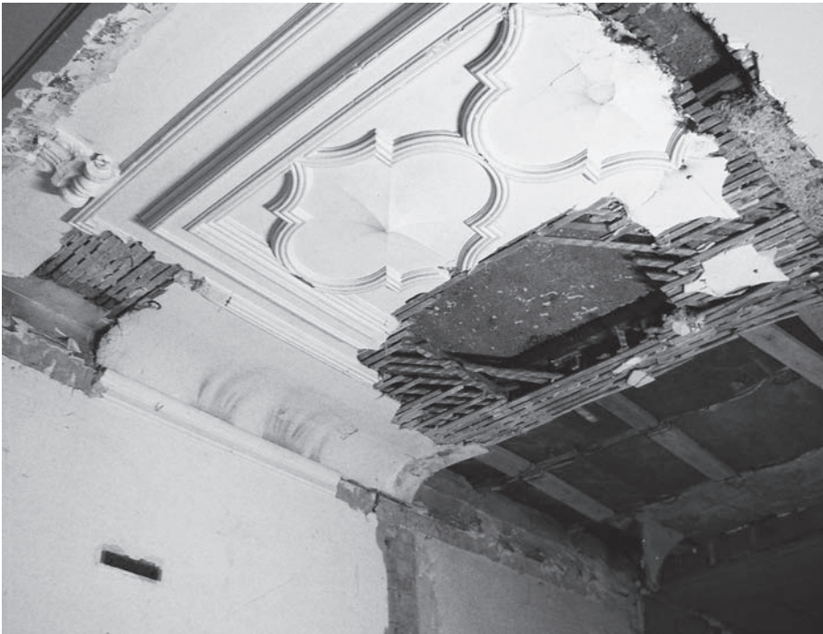
Knifflige Arbeit: Diese stark lädierte Stuckdecke musste restauriert werden.