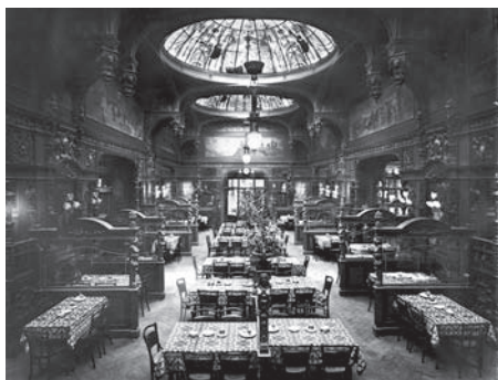
Anno dazumal: Der Restaurationssaal des «Grand-Café Metropol» um 1905.