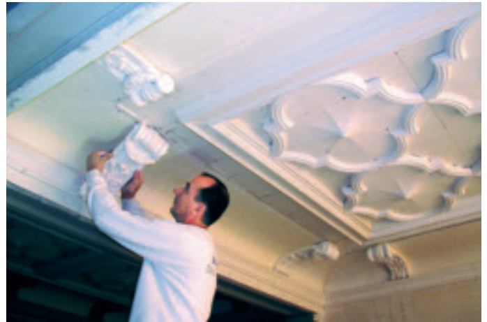
Bajram Kashtanjevatc bringt die Konsolen an. Gut zu erkennen sind die Schraubenlöcher für zusätzliche Befestigungen von Deckenelementen und Konsolen.