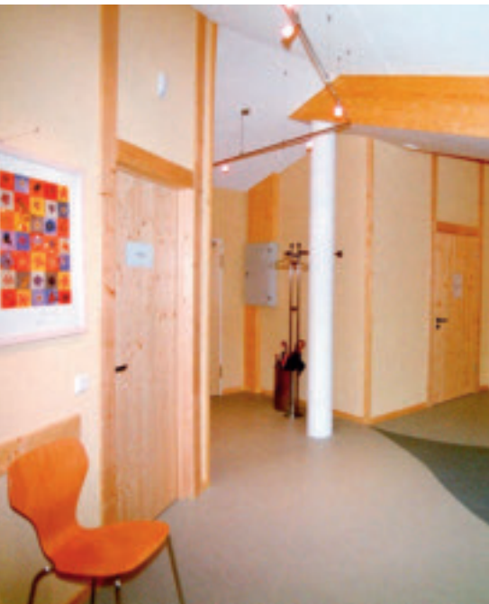
4 Alle Oberflächen des Ärztehauses in Waldbröl sind mit farbigem oder weissem Lehm verputzt und mit einer Lehmfarbe gestrichen.

stark genug verdichtet, sodass seine Oberfläche nach dem Trocknen leicht sandete. Zudem zeichneten sich Ausbesserungsstellen durch Pigmentanreicherung am Rand ab. Aus diesem Grund wurden alle Flächen noch einmal mit einer Lehmfarbe überarbeitet (Bild 4).