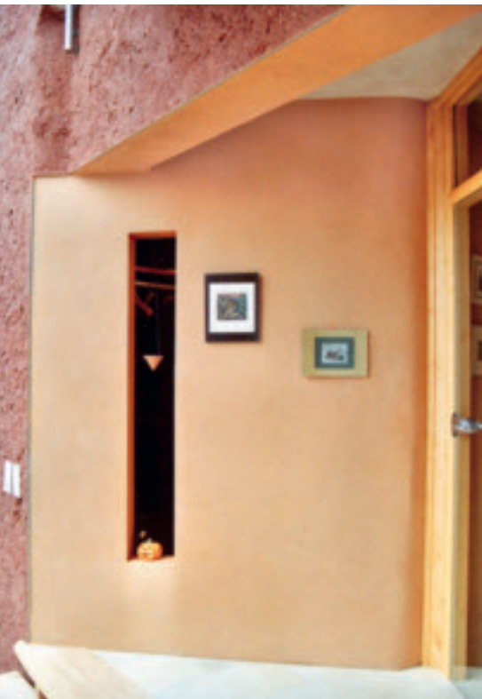
5 Wo der Innenraum in den Aussenraum übergeht, wurde bei diesem Wohnhaus in Weyerbusch bei Bonn die Natürlichkeit und Erdigkeit von Lehm durch den Kontrast von feinem und sehr grobem Korn nochmals betont.

putz, bei dem man noch die Auftrags-spuren sieht, besitzt eine ursprüngliche Schönheit. Durch Weiterbeschichtung kann ein kunsthandwerkliches Unikat entstehen. Ob künstlerische Sgraffiti oder schablonierte Ornamente, geglättete oder durch eingefärbtes Wachs angefeuerte Flächen – Lehm bietet viele Möglichkeiten, handwerkliche Kreativität zu verkaufen. Seine sicht- und fühlbare Körnung vermittelt Ruhe und ein Gefühl von Geborgenheit. Die natürlichen Erdtöne Rot, Gelb oder Schwarz wirken angenehm warm. Mit Weiss und anderen Pigmenttöne lässt sich auch ein eindeutig modernes Ambiente vermitteln.