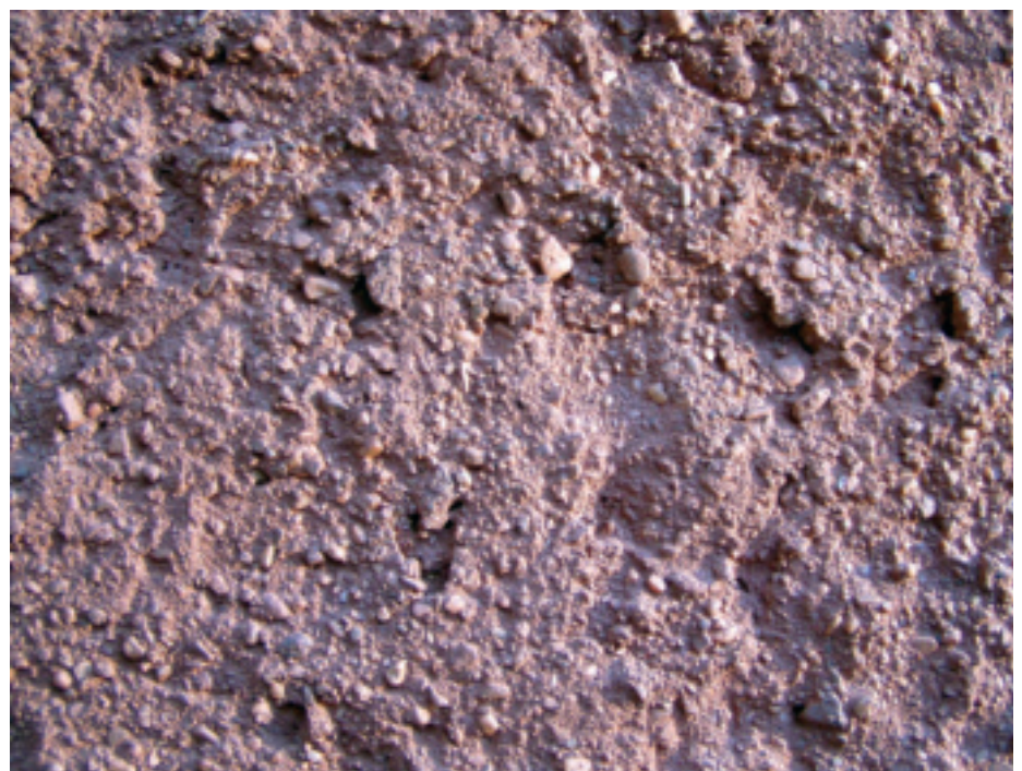
6 Sehr lebendig ist die Struktur der Mischung aus Kieselsteinen und reinem Ton auf dieser Aussenfassade. Sie wurde in Klumpen angeworfen, wenig verschlichtet und sandgestrahlt.

Vorbild für die angestrebte Oberfläche war die rotbraune, raue Schale einer Litschi-Frucht. Um deren Rauigkeit und Färbung zu erreichen, wurden Mischungen aus reinem roten Tonmehl, Sand und bis zu 2 cm grossen Kieselsteinen hergestellt und in mehreren Versuchen optimiert. Die Lebendigkeit der Struktur wurde dadurch intensiviert, dass die Mischung in Klumpen aufgeworfen, wenig verschlichtet und nach dem Trocknen sandgestrahlt wurde (Bild 6). Am Ende wurde die Oberfläche noch mit einer farblosen Kaseinlasur stabilisiert. ■