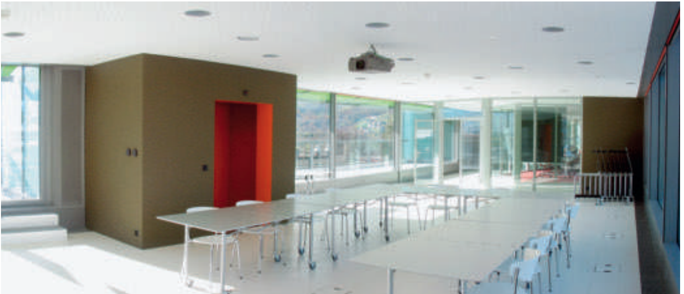
Nanoskaliges Titandioxid in Anstrichstoffen wirkt bei UV-Bestrahlung fotokatalytisch, was eine saubere Raumluft verspricht.

gesehen vorderste Plätze ein. Die EU gibt heute jährlich über 800 Millionen EUR an Fördermitteln für die Nanotechnologie aus (gleich viel wie die USA). In Deutschland beschäftigen sich ungefähr 500 Firmen, in der Schweiz bereits etwa 150 Unternehmen mit dieser Technologie.