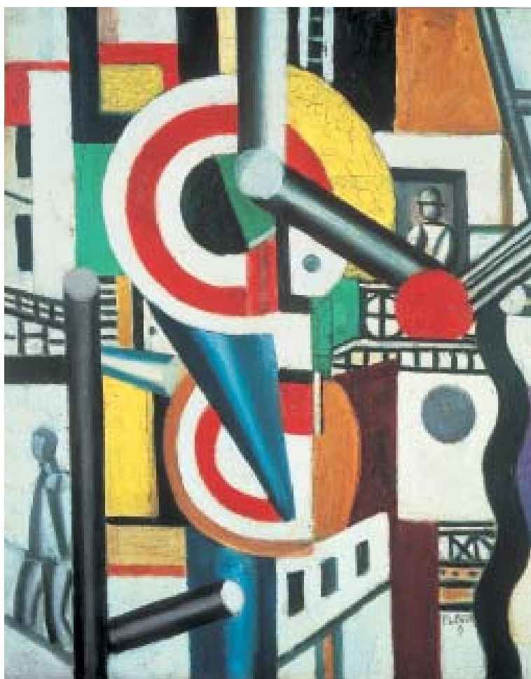
Fernand Léger: Les deux disques dans la ville, 1919, Öl auf Leinwand, 65,6 × 54,3 cm.