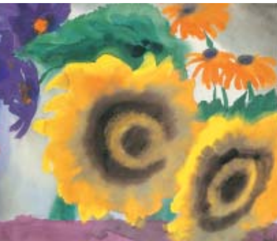
Emil Nolde: Sonnenblumen, 1930–1935, Aquarell auf Japanpapier, 35,5 × 44 cm.

Ganz anders wirken die Farben beim Expressionisten Ernst Ludwig Kirchner (1880–1938), der durch seinen länge-