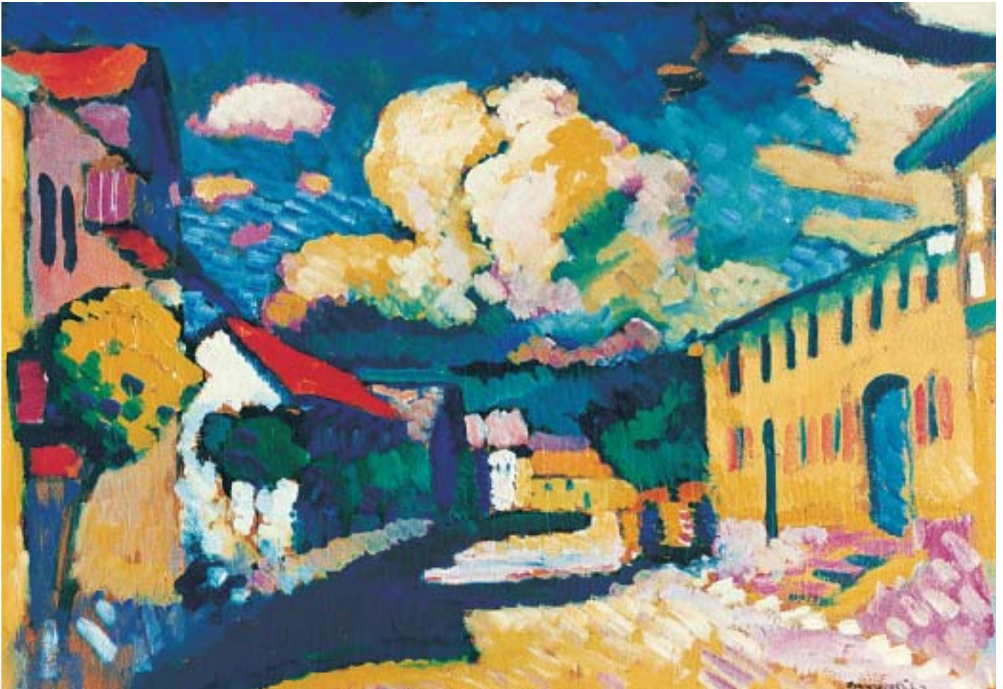
Wassily Kandinsky: Murnau – Dorfstrasse, 1908, Öl auf Karton, nachträglich auf Holz montiert, 48 × 69,5 cm. (© ProLitteris, Zürich)

ren Aufenthalt in Davos auch enge Beziehungen zur Schweiz unterhielt. Prall leuchten die Farben auf seinem Atelierbild «Mädchen mit Katze, Fränzi», und bei den beiden Akten bringen das blaue Sofa und die rote Tischdecke eine besondere Spannung ins Bild. Erst die kräftig gelben Räder akzentuieren Kirchners 1920–21 entstandenes Pferdagespann mit drei Bauern. Mit intensiven Farben und dem für ihn typischen Violett hielt Kirchner die Bergwelt von Davos mit dynamischen, fließenden Formen fest (zum Beispiel in der «Land-