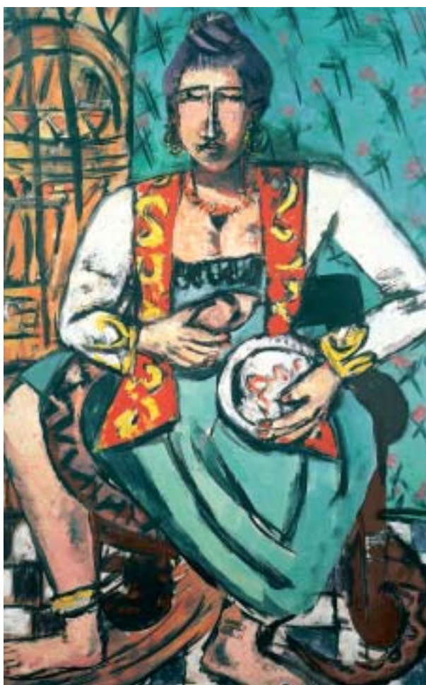
Max Beckmann: Frau mit Schlange (Schlangenbeschwörerin), 1940, Öl auf Leinwand, 145,5 × 91 cm. (© ProLitteris, Zürich)