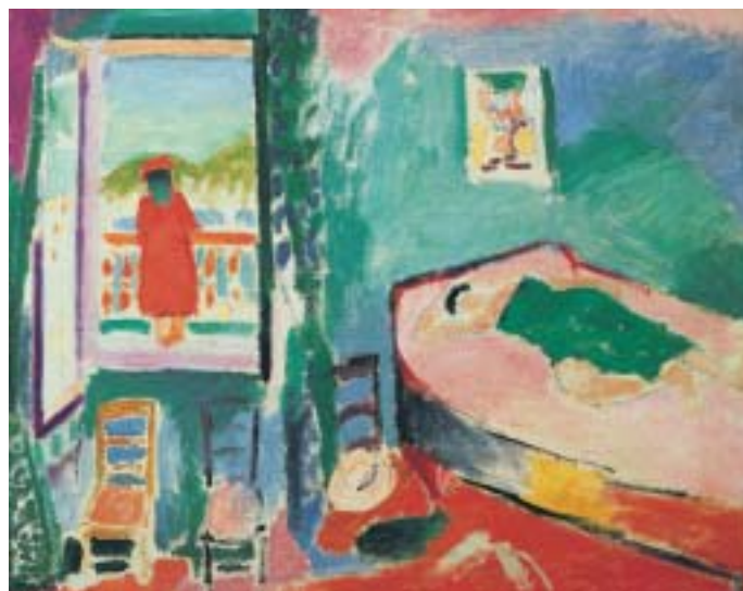
Henri Matisse: Intérieur à Collioure (La Sieste), 1905, Öl auf Leinwand, 60 × 73 cm.