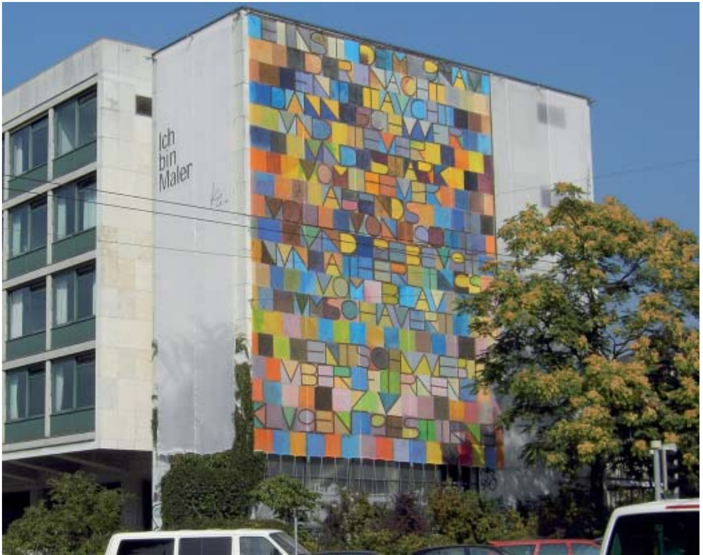
So sah die Fassade des GIBB-Gebäudes von September 2005 bis Februar 2006 aus.

dem Grau der Nacht enttaucht...» von Paul Klee zu kopieren und im Grossformat auszuführen. Das 1918 geschaffene Werk besteht aus dreihundert Quadraten und ermöglichte es jedem Lehrling, «sein» Quadrat zu veröffentlichen. Zusätzlich sollte das Bild mit dem Schriftzug von Paul Klee «Ich bin Maler» und mit seinem Selbstbildnis ergänzt werden.