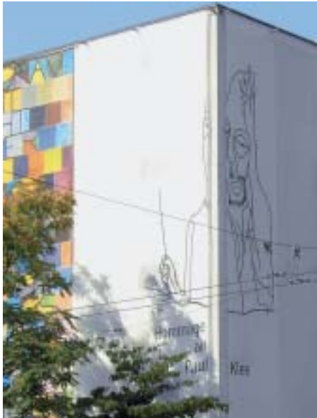
Auch ein Selbstporträt Paul Klees wurde aufgemalt.