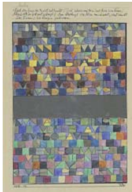
Ausgehend von diesem Aquarell Paul Klees, schufen die Malerklassen der Gewerblich-Industriellen Berufsschule Bern ein 15 m hohes Fassadenbild.