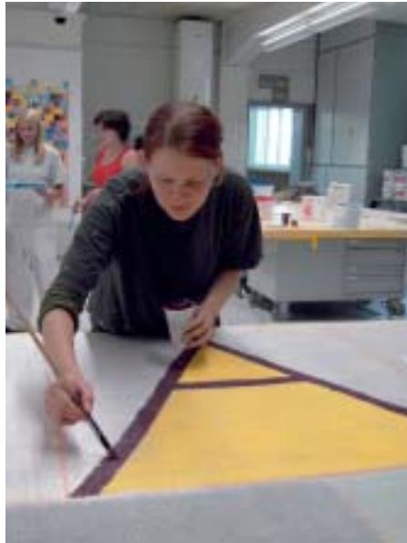
Die Lehrlinge verwendeten Dispersionsfarben, die sie auf ein Kunstfasernetz auftrugen.