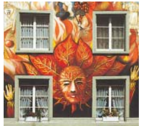
Ausschnitt aus der Fassadenmalerei am Fritschi-Haus am Sternenplatz, 1985 ausgeführt von Robert Ottinger.

I wie Intervall: Die Fachmesse appli-tech findet in einem Intervall von jeweils drei Jahren statt. Erstmals wurde sie im Jahr 2000 durchgeführt, die vierte Ausstellung wird im Jahr 2009 stattfinden.