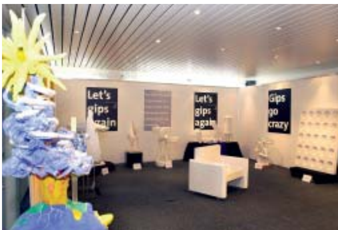
Verrückte Gipsobjekte sind in Halle 3 am Stand D360 zu sehen.