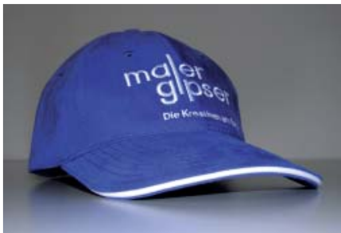
Mit der Maler-Gipser-Dächlikappe können Lehrlinge etwas gewinnen.

J wie Jacken: Die Garderoben für Jacken und Mäntel befinden sich jeweils im Parterre in den Hallen 1 und 3. Sie sind kostenlos, jedoch unbedient und unbewacht.