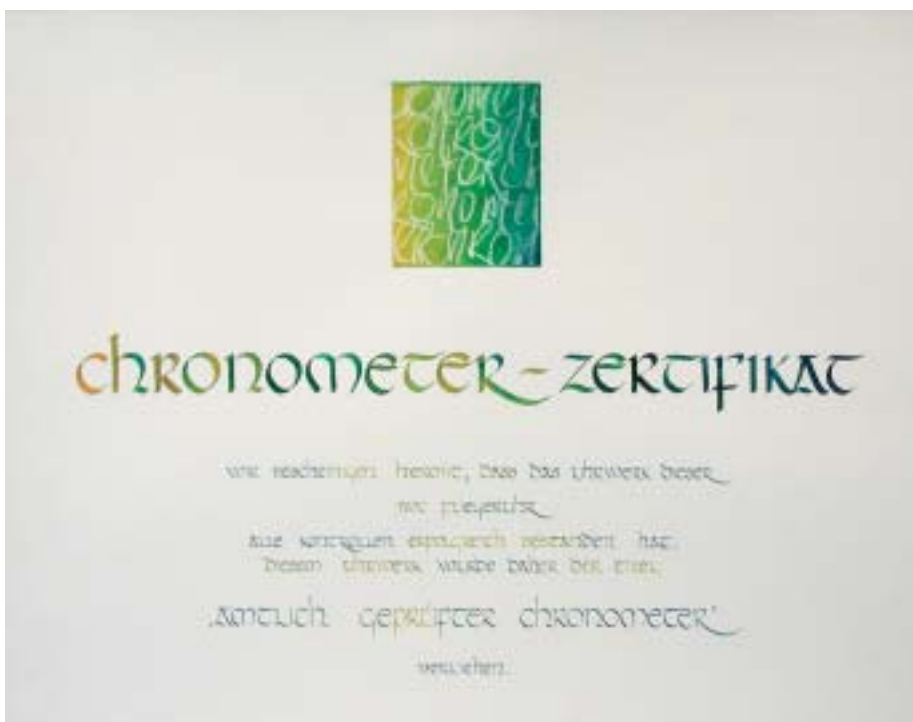
Das Kalligrafieren ist nach wie vor ein wichtiger Bestandteil in der Berufsausbildung des Schrift- und Reklamegestalters.

Mit Kalligrafie im betrieblichen Umfeld Geld zu verdienen, ist nur in Ausnahmefällen möglich. Was bei den Kunden Anklang findet, sind grosse Werbebanner, Fahrzeuge mit attraktiven Visualisierungen und eine riesige Vielfalt von Schriften. Die technisch machbaren Reproduktionen fast unbegrenzter Formen und Bilder stellen hohe Ansprüche an die gestalterischen Fähig-