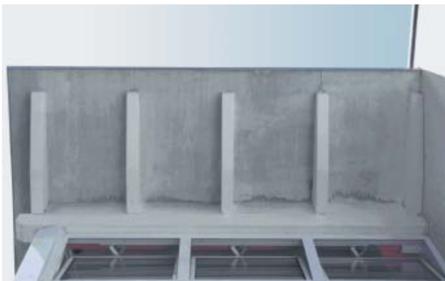
Flächiger Pilzbefall auf den Holzwerkstoffplatten einer Dachuntersicht. Es fällt auf, dass die Platten befallen sind, nicht jedoch die Sparren.