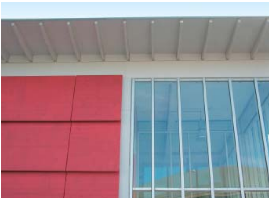
Es geht auch ohne Befall: Diese Dachuntersichten und Fassadenverkleidungen wurden vor fünf Jahren mit einer Holzfarbe auf Basis einer wasserverdünnbaren Kunststoffdispersion beschichtet, die algizid und fungizid ausgerüstet ist.