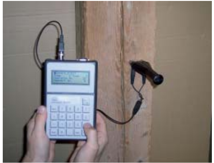
Feuchte Untergründe verursachen häufig Probleme. Eine korrekte Feuchtemessung ist deshalb von grosser Bedeutung.

Objekt durchgeführt, z.B. die Haftzugfestigkeit von Beschichtungen in Tunnels.