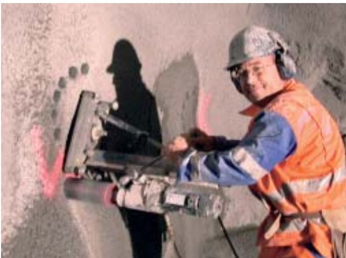
Häufig müssen auf der Baustelle Bohrkern entnommen werden, die dann im Labor untersucht werden.

Neu führt die LPM AG auch Untersuchungen von Beschichtungen und Anstrichen durch, seien es Beschichtungen auf Holz, Fassadenanstriche auf mineralischen Untergründen oder Korrosionsschutzbeschichtungen. Gerade bei der Beurteilung von Beschichtungen steht die Analyse vor Ort im Vordergrund. Hier werden die Schäden fotografisch dokumentiert und Probematerial entnommen, das im Labor untersucht wird. Die Bestimmung der Schichtdicken, die chemische Untersuchung mit Infrarotspektroskopie, die Messung der Haftfestigkeit und die Bestimmung der Resistenz gegen aggressive Medien stehen im Vordergrund. Daneben werden aber auch Prüfungen am