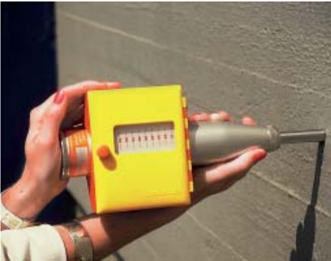
Hier wird die Betonfestigkeit mit dem Schmid-Hammer geprüft.