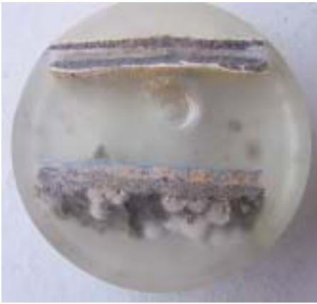
Eingebettete Aufbauten von Kunstharzputzen zur mikroskopischen Untersuchung.

demittel, Schadeneinflüsse und andere Parameter möglich. Der Dünnschliff erlaubt darüber hinaus Aussagen über Veränderungen von Beton, die durch die Einwirkung von Wasser oder der Atmosphäre entstanden sind. Diese Prüfmethoden werden auch bei von Kunden eingesandten Betonproben angewendet, um Aussagen über deren Qualität zu erhalten.