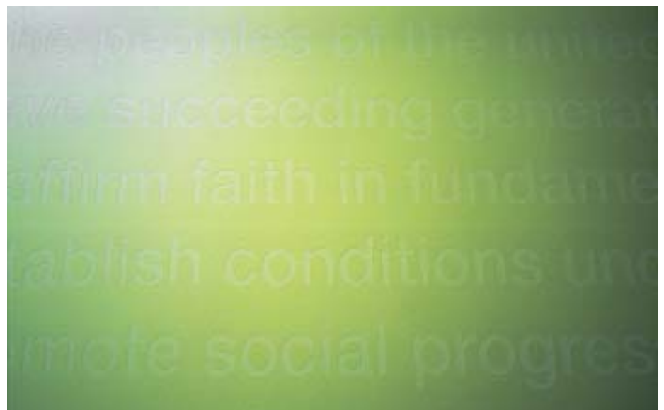
Aufgebracht mit Schablonen, ziert ein Ausschnitt aus der Gründungs-Charta der Uno die Wand zum Plenarsaal. Die Gestaltung – grün in grün – ist sehr dezent gehalten.

Die in Leichtbauweise errichteten Wände wurden von dem auf dem Bau verantwortlichen Gips-Vorarbeiter Giuseppe Lombardo und seinen Leuten von der Firma Kradolfer konstruiert und mit Gipskartonplatten doppelt beplankt. Für enge Radien verwendeten die Gips-er vorgeformte Elemente der Protektor Profil GmbH, Regensdorf. Auf die Gipskartonplatten wurden eine Grundputzschicht und anschliessend ein Weissputz aufgebracht. Zur Schallisolation