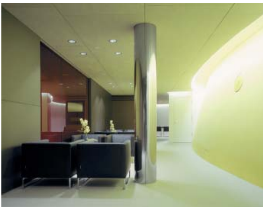
Im Raum GA-200 bereiten sich die Redner auf ihre Auftritte im Plenarsaal der Uno vor. Dieser liegt hinter der gekrümmten Wand (rechts).

Auch an administrativ Ungewöhnliches galt es sich zu gewöhnen. Bei