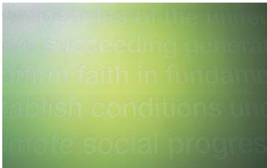
Aufgebracht mit Schablonen, ziert ein Ausschnitt aus der Gründungs-Charta der Uno die Wand zum Plenarsaal. Die Gestaltung – grün in grün – ist sehr dezent gehalten.

Die in Leichtbauweise errichteten Wände wurden von dem auf dem Bau verantwortlichen Gips-Vorarbeiter Giuseppe Lombardo und seinen Leuten von der Firma Kradolfer konstruiert und mit Gipskartonplatten doppelt beplankt. Für enge Radien verwendeten die Gips-er vorgeformte Elemente der Protektor Profil GmbH, Regensdorf. Auf die Gipskartonplatten wurden eine Grundputzschicht und anschliessend ein Weissputz aufgebracht. Zur Schallisolation