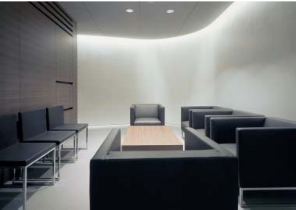
Ein Lichtband im Deckenbereich beleuchtet die weissen Wände. Wegen des Streiflichts, das jede Unebenheit hervorhebt, mussten die Gipsarbeiten sehr sorgfältig ausgeführt werden.

jedem Betreten der Baustelle mussten die Handwerker Sicherheitskontrollen über sich ergehen lassen. Jeder hatte zudem sichtbar einen besonderen Ausweis (Badge) auf sich zu tragen. Weil der Betrieb des Gebäudes während der Bauarbeiten aufrechterhalten blieb, konnten Arbeiten mit Lärmemissionen nur während gewisser Zeiten am Tag ausgeführt werden. Das Abladen von Material musste nachts erfolgen, damit