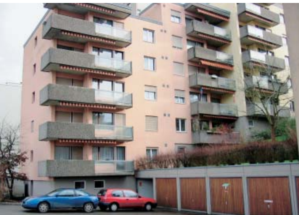
5 Ein Mehrfamilienhaus in Biel, wo einem überzeugten Verarbeiter von Silikatfarben für einmal das zu verwendende Produkt vorgeschrieben wurde. Er musste 1997 eine qualitativ gute Silikonharzfarbe verwenden.

Die Werte für Wasseraufnahme und Dampfdurchlässigkeit gehören zu den wichtigsten bauphysikalischen Daten von Fassadenfarben überhaupt. In den letzten Jahren sorgten geschickte