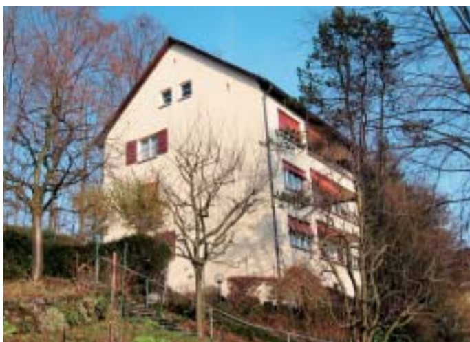
2 Seitenansicht einer Fassade in Luzern, die 1978 mit Organosilikatfarbe gestrichen wurde (Aufnahme vom Dezember 2004). Trotz nur geringem konstruktivem Schutz und viel Bewuchs und Baumbestand in der Umgebung ist die Fassade auch nach einem Vierteljahrhundert noch sauber sowie algen- und moosfrei.