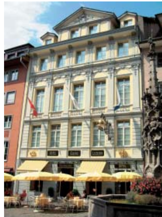
7 Eine Altstadtfassade in Luzern mit reichen Stuckaturen, 1993 mit einer Organosilikatfarbe gestrichen. Trotz vieler auskragender Bauteile sind keine Abläufer und keine erkennbare Verschmutzung vorhanden.

Der Vollständigkeit halber muss in diesem Bereich auf einen Missstand hingewiesen werden: In der Schweiz ist keine Norm für Silikatfarben und Organosilikatfarben vergleichbar mit der DIN 18363 Abs. 2.4.1 oder der EN vorhanden. Die DIN sagt klar, dass der Kunststoffgehalt einer Organosilikatfarbe maximal 5% betragen darf. In der Schweiz aber kann jeder Farbenhersteller den Kunststoffgehalt in seiner Mineralfarbe beliebig variieren. Analysen verschiedener in der Schweiz hergestellter Produkte mit der Bezeichnung Mineralfarbe, Organosilikatfarbe usw. haben immer wieder ergeben, dass keine der untersuchten Farben die DIN-Forderung nach maximal 5% Kunststoffgehalt