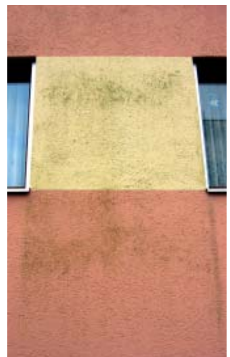
6 Schon nach wenigen Jahren bildeten sich an dem Haus in Bild 5 Abläufer sowie starker Algen- und Moosbewuchs.