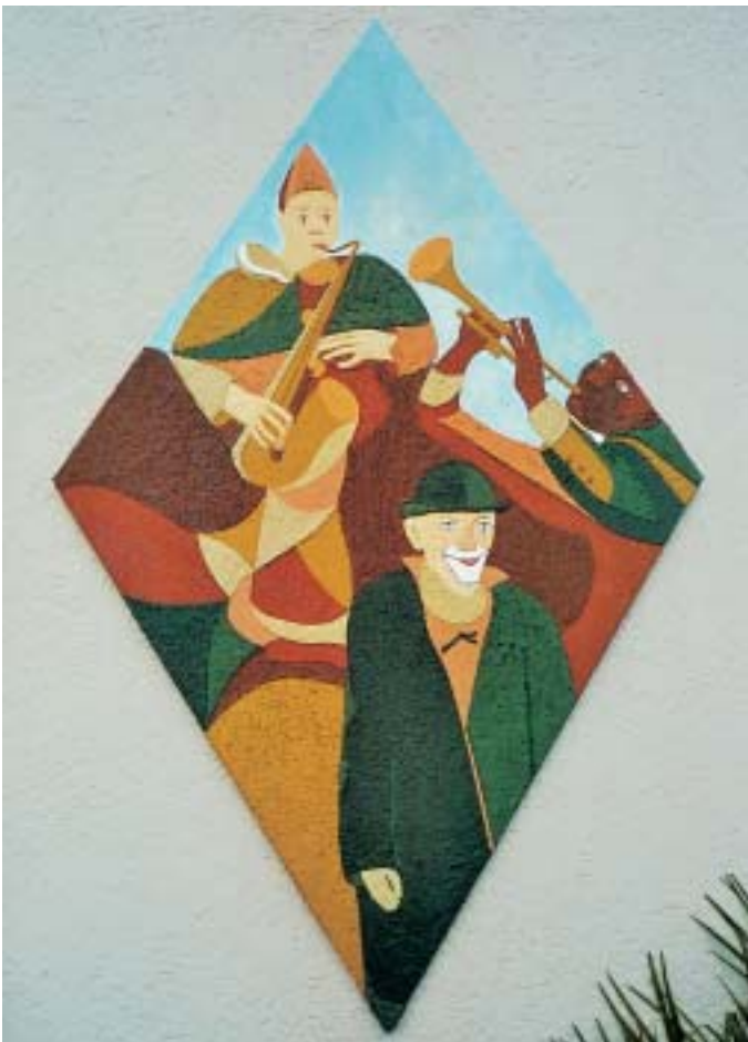
Das Plastrato «Omaggio a Grock» entstand 2003 und befindet sich in Gordevio TI (Maggiatal). Es ist dem weltberühmten Schweizer Clown Grock (1880–1959) gewidmet. Der Rhombus hat Ausmasse von 200 × 125 cm.

wüstlichen Materials trotzen sie dem Sturm der Zeiten, als seien sie für die Ewigkeit geschaffen.