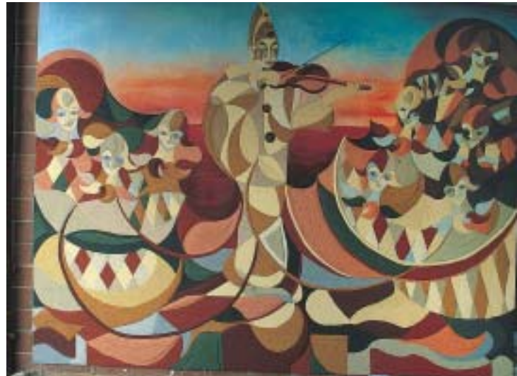
Der «Tanz der Harlequine» (200 x 300 cm gross) schmückt die Eingangshalle einer Privatliegenschaft in Schenkon LU.