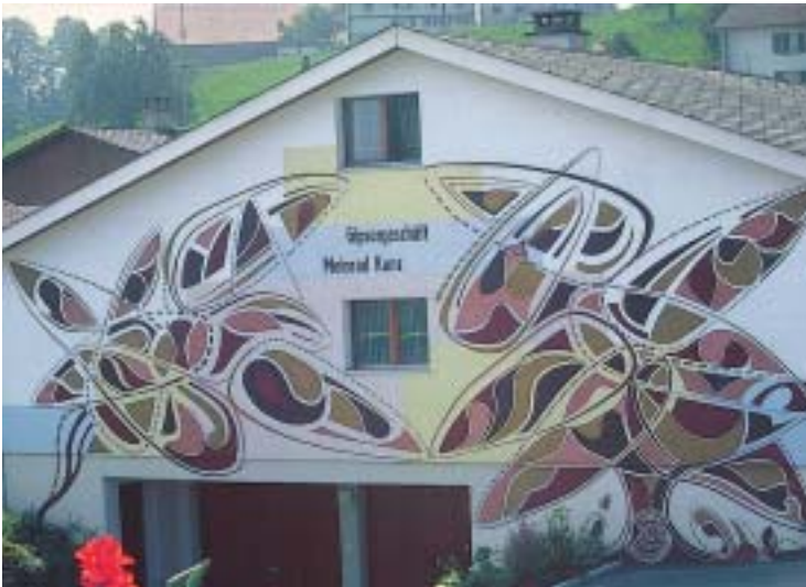
C. F. Trinys flächenmässig grösste Fassadengestaltung in Neuenkirch LU mit dem Thema «Bewegtes Entfalten» ist 1979 entstanden. Die Plastrato-Technik erwies sich als ausserordentlich licht- und witterungsbeständig.