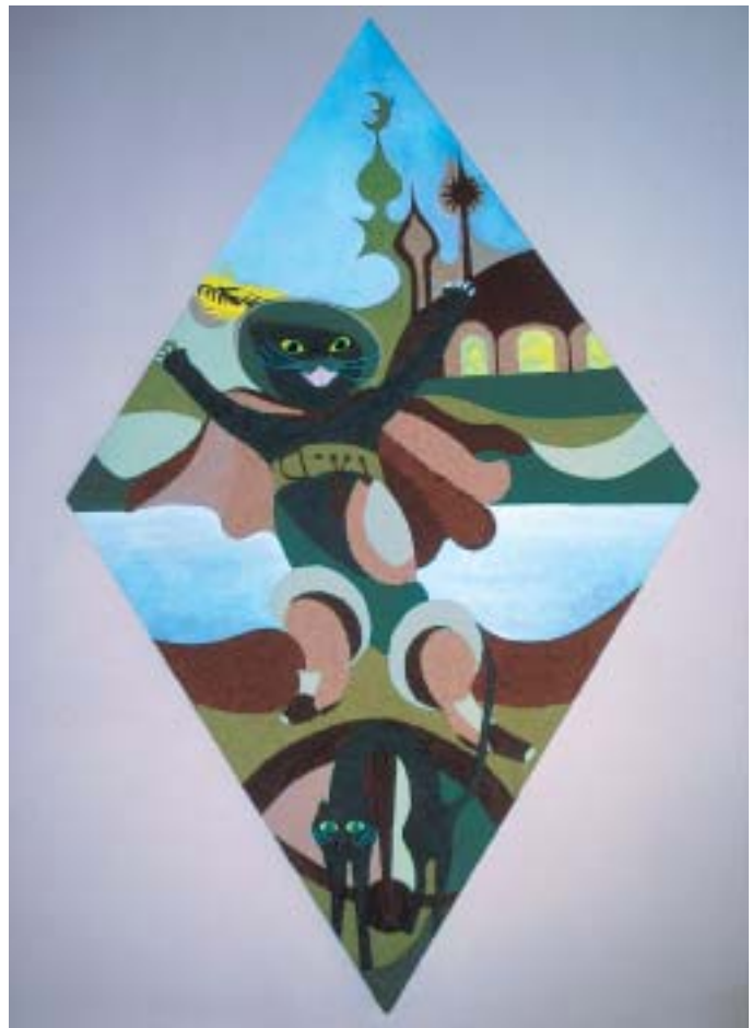
«Der gestiefelte Kater» ist ein rhombisches Tafel-Plastrato (200 × 125 cm), das sich im Centro Leoni (Ristorante Ristorally) in Riazzino TI befindet. Geschaffen wurde es 2003.