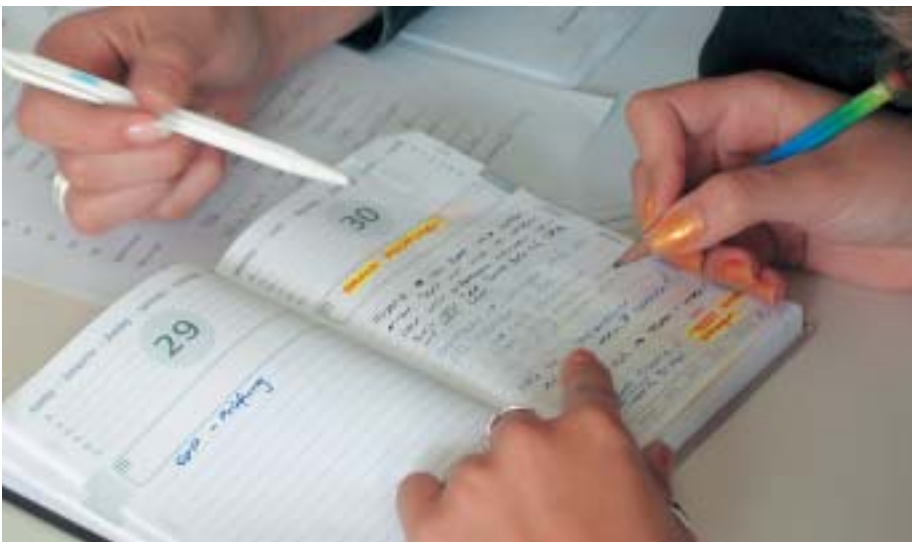
Lernen nach Plan: Im Aufgabenheft wird notiert, was bis wann zu lernen ist.

Manche Lehrlinge schieben das Lernen bis auf den Vorabend des Schultages vor sich her. Dann gehen sie an ihr Pult und bleiben dort die nächsten paar Stunden wie angeklebt vor ihren Büchern und Heften sitzen. Das ist jedoch