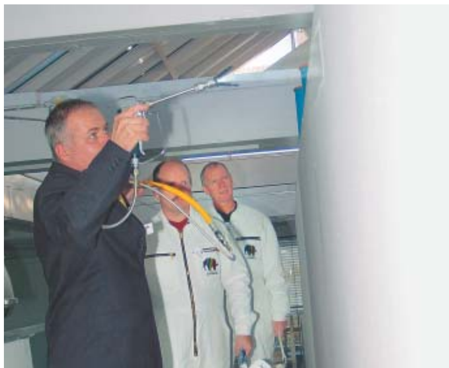
Ein Anwendungstechniker wagt sich im dunklen Anzug aufs Gerüst – nebelarmes Sprühen machts möglich.

Weil man für das richtige Spritzen ein eingespieltes Team benötigt. Am