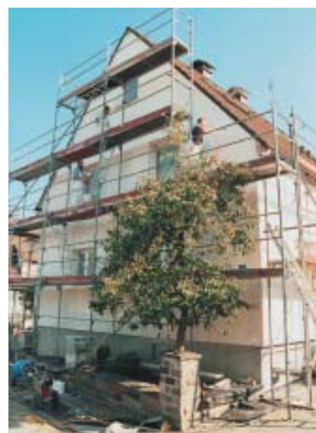
Rationell: Schon bei der Renovierung von Ein- und Zweifamilienhäusern ist der Einsatz des Nespri-Tec-Systems wirtschaftlich.

Bei den Untersuchungen wurde festgestellt, dass bei bestimmten Temperaturen weniger Overspray entsteht. Wenn die Farbe zu kalt ist, wird sie zähflüssiger. Um sie mit dem Airlessgerät verarbeiten zu können, müsste sie mit Wasser verdünnt werden. Dies würde jedoch die für ein nebelarmes Spritzen notwendigen strömungsmechanischen Eigenschaften wieder zerstören, indem mit dem Wasser auch der Overspray wieder zunähme. Zur Vermeidung dieses Ef-