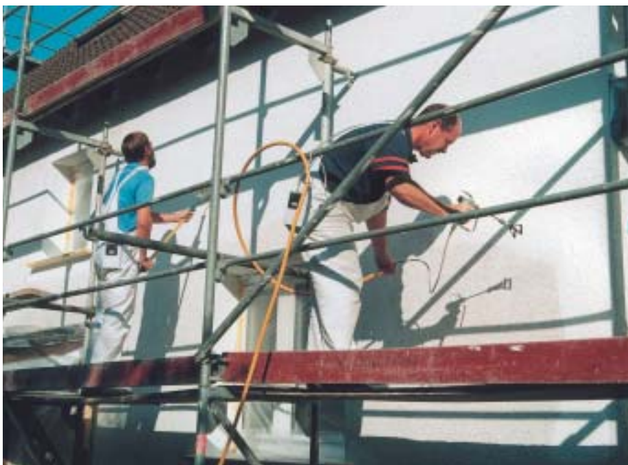
Spritzen und nachrollen: Bei hoher Flächenleistung und nebelarmem Spritzauftrag ergeben sich deutliche Zeit- und Kostenvorteile.

kömmlichen Airless-Spritzen besteht. Dafür wurde das Tropfenspektrum in Zeitlupenstudien ausgewertet. Dabei stellte sich heraus, dass der Spitznebel vor allem durch die kleinsten Tröpfchen entsteht. Diese werden durch unvermeidliche Luftströmungen davongetragen und schlagen sich in der Umgebung nieder. Auch seitliches Spritzen und das Abprallen von Farbpartikeln an der Wand führen zu Spritznebel.