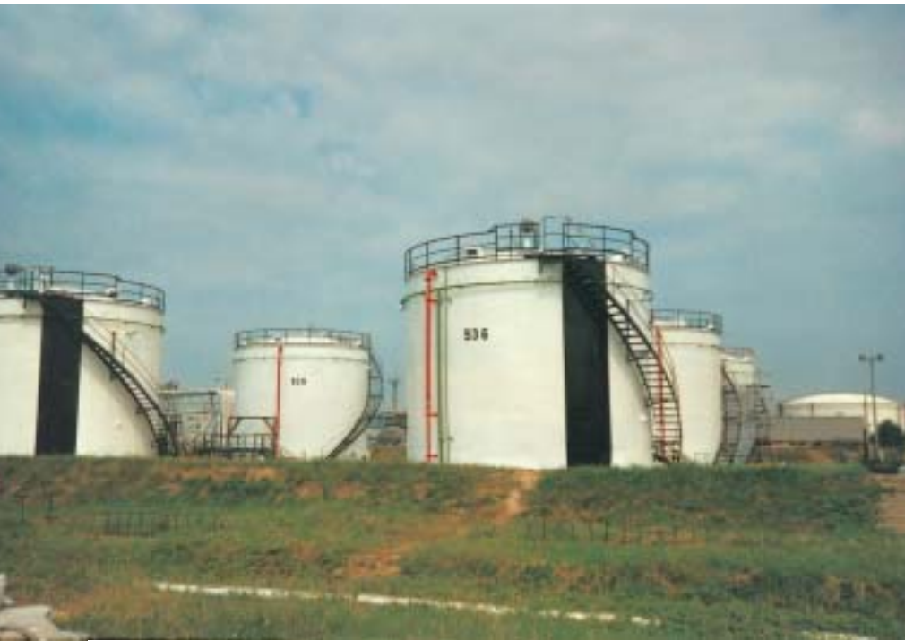
Diese Stehtanks in Százhalombatta (Ungarn) wurden mit einer Acryl-/Alkyd-Korrosionsschutzgrundierung und einem acrylmodifizierten Alkydharz-Decklack beschichtet, beides wasserverdünnbare Produkte.