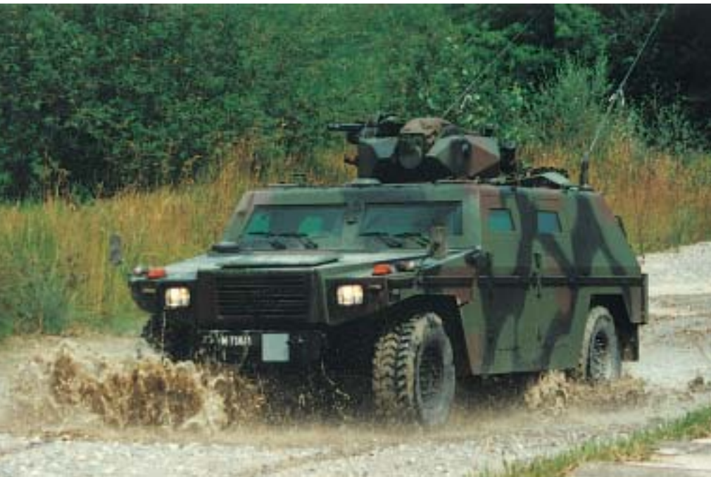
An Armeefahrzeuge werden besonders hohe Anforderungen gestellt. Dieser Eagle 4x4 von Mowag ist mit wasserverdünnbaren Anstrichstoffen beschichtet (zweifache Acryl-/Alkyd-Korrosionsschutzgrundierung und 2K-PU-Lack matt).

die Innenanwendung, als auch im Außenbereich – mit sehr gutem Erfolg eingesetzt. Nachfolgend einige Beispiele.