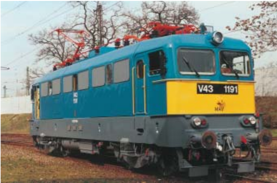
Eine ungarische Lokomotive, die mit Acryl-/Alkyd-Korrosionsschutz grundiert und mit einem 2K-PU-Decklack versehen wurde. Diese wasserverdünnbaren Anstrichstoffe stehen in ihren Eigenschaften lösemittelhaltigen Produkten in keiner Weise nach.

wickelte Rohstoffe der chemischen Industrie erreicht werden.