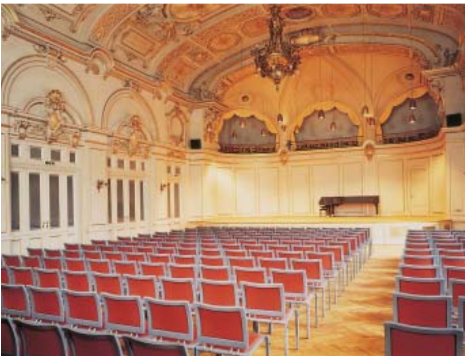
Der restaurierte kleine Saal der Zürcher Tonhalle erstrahlt in neuem Glanz

Die sechs grossen Deckenfelder voller Leben und Bewegung stellen die Idee des göttlichen Ursprungs der Musik dar. Geflügelte Kinder wiegen sich im Kranz von Rosen, die Göttin der Musik schwebt über der Erde, Apollos