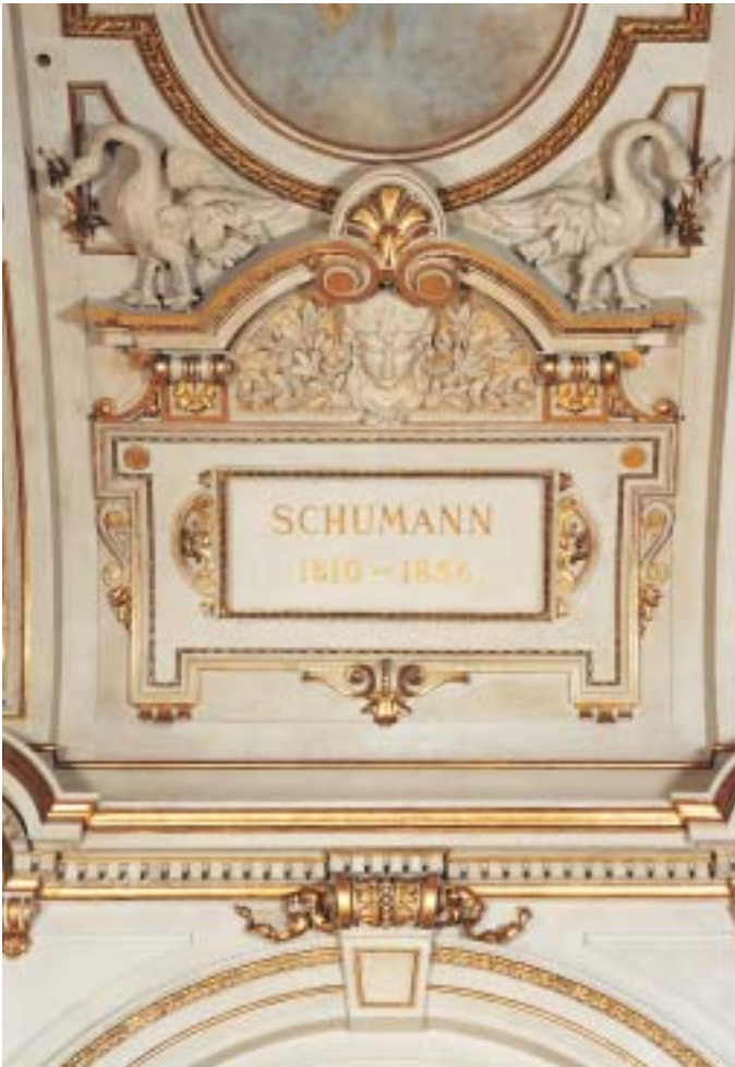
Am unteren Rand der Deckenwölbung erscheinen die Namen berühmter Komponisten