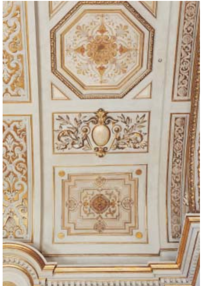
Details der Decke des kleinen Tonhallsaals

kantonalen Denkmalpflege schlossen sich 14 mehrheitlich unabhängige Restauratorinnen und Restauratoren zu einer Arbeitsgemeinschaft zusammen und führten den Auftrag als Generalunternehmung aus.