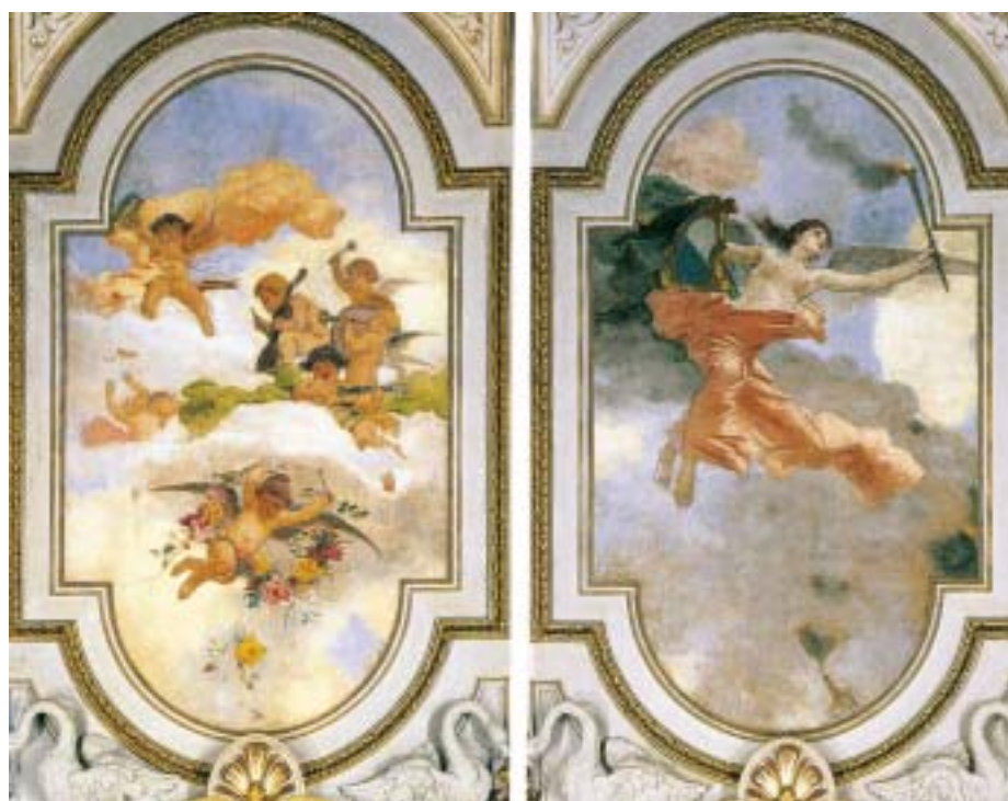
Zwei von sechs Deckengemälden von Antonio Barzaghi-Cattaneo

Preis: CHF 67.–. Weitere Informationen unter www.denkmalpflege.zh.ch .