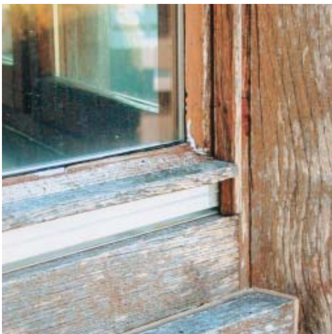
2) Schadensbild vor Beginn der Renovationsarbeiten