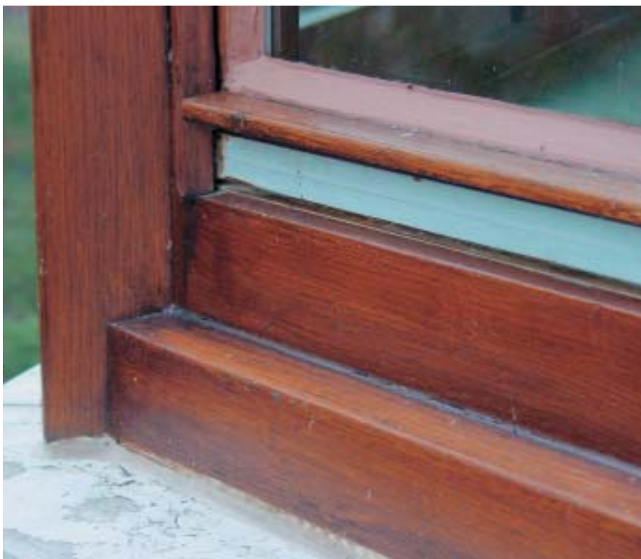
6) Erkerdetail im 5. Stockwerk: einwandfreier Zustand des Fensteranstriches nach zirka fünf Jahren