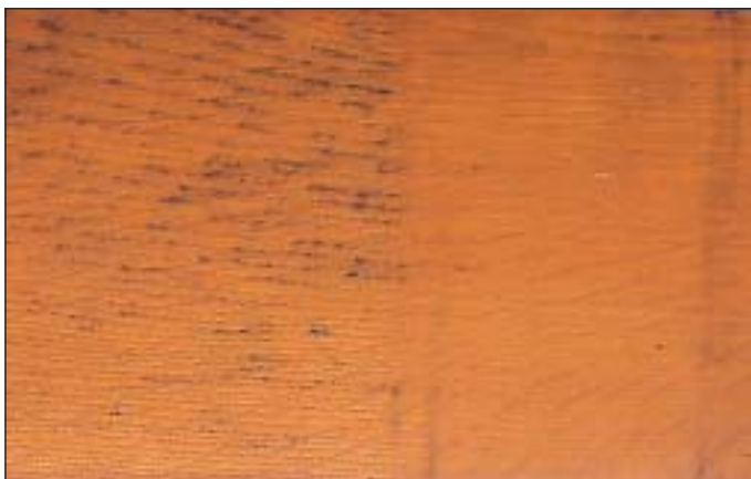
4) Eichenholztafeln mit Versuchsanstrichen nach 24 Monaten Bewitterung 45° SW ohne Spachtelung mit Spachtelung

Bei der Instandsetzung von Fensteranstrichen muss besonderes Augenmerk auf die Wasserdampfdiffusion gerichtet werden. Zur Vermeidung von Feuchteschäden hinter dem Aussenanstrich muss der innere Anstrich mindestens gleich beziehungsweise dampfdichter sein wie der Aussenanstrich. Im vorliegenden Fall wurde diese feuchtephysikalische Vorgabe erfüllt, da der Altanstrich im Aussenbereich restlos entfernt wurde und im Innenbereich ein zusätzlicher Klarlackanstrich auf den bestehenden intakten Altanstrich aufgebracht wurde (Bild 6).