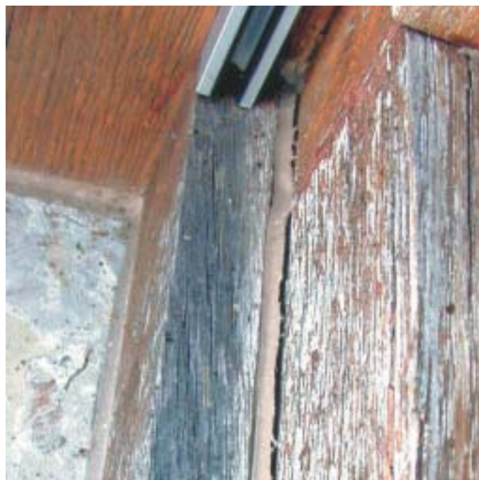
3) Völlig zerstörter Fensteranstrich und nicht mehr funktionstüchtige Kittfugen

strichen. Die Kittfuge war teilweise sehr breit. An vielen Stellen war die Kittfuge vom Fensterglas und auch vom Holz abgerissen. Der Ölkitt war teilweise versprödet und gerissen. Die mit einem elastischen, synthetischen Kitt ausgeführte Fuge zwischen Holzrahmen und Steineinfassung war im unteren Bereich abgerissen und liess Wasser ungehindert eintreten. Die gesamten Innenflächen der Holzfenster waren in einem tadellosen Zustand (Bilder 2 und 3).