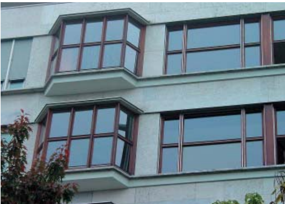
1) Konstruktive Bausünden aus den Vierzigerjahren: Eichenholzfenster stehen ungeschützt im Wetter

Das Eichenholz zeigte zwei bis drei Millimeter tiefe Verwitterungsrisse. Die Porenstruktur des Eichenholzes ist sehr ausgeprägt. Als Fensterkitt wurde ein Ölkitt eingesetzt und mit der Lasur über-