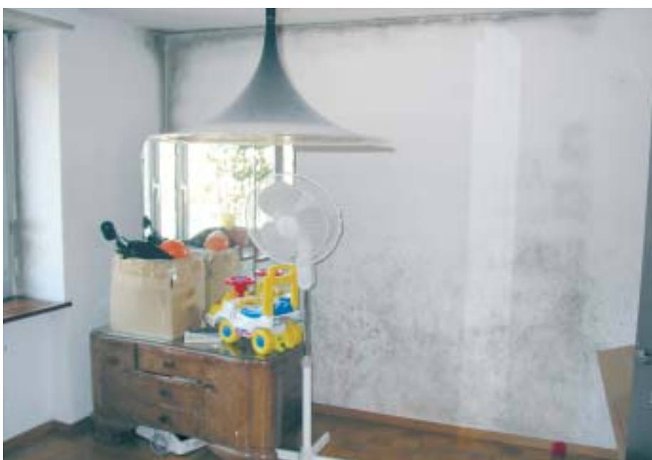
7 Schimmelbefall in der «indischen» Wohnung

Untergenutzt, schlecht beziehungsweise wenig beheizt und kaum gelüftet – typische Voraussetzungen für eine Ferienwohnung und geeignet, von Schimmel befallen zu werden. Der Bauherr entschloss sich deshalb vor Jahren, die Aussenwände mit einer Isolation zu versehen. Innert kürzester Zeit zeichneten sich aber Fugen und Stösse der EPS-Platten sowie die Dübelköpfe ab. An diesen Kältebrückenoberflächen bildeten sich dunkle Verfärbungen. Bei der mikroskopischen Begutachtung der