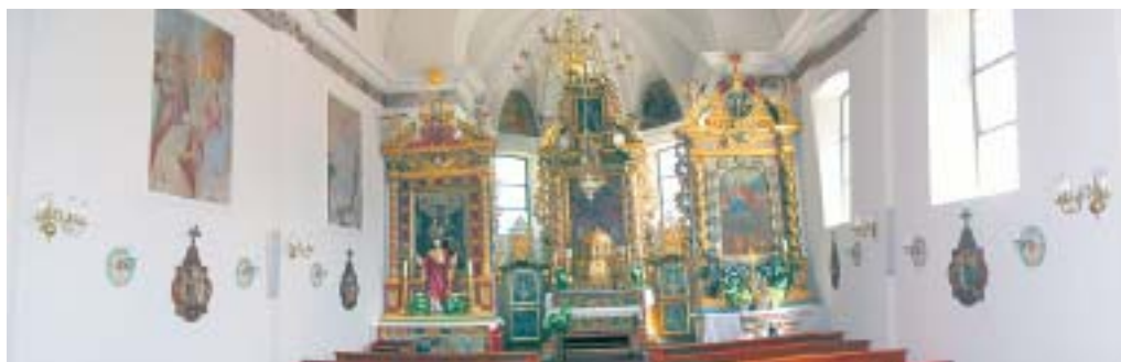
6 Gesamtbild acht Monate nach der Renovation

Die Wände wurden zunächst mit warmem Wasser oberflächlich vom Schimmel befreit, bevor die gesamte Wandfläche