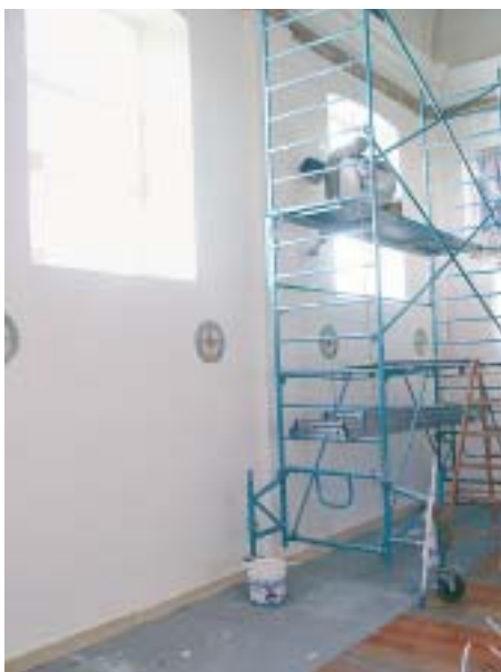
5 Zwischen- und Deckenstrich mit der Spezialfarbe

gen Familienmitglieder satt zu bekommen. Gelüftet wird so gut wie nie. Die Aussenwand ist nicht isoliert und mit Möbel vollgestellt. Hinter den Möbeln wächst ein ansehnlicher Pilzrasen heran, der auch durch zweimalige Renovation mit Dispersionsfarbe nicht zum Verschwinden gebracht werden kann (Bild 7).