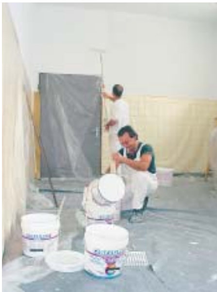
13 Einfache, problemlose Verarbeitung

herrschaft musste erneut auf richtiges Lüften hingewiesen werden. Offene Kippfenster sind oftmals die Ursache für Kondenswasserbildung auf Decken oder Wänden in diesem Bereich. Alle anderen Decken- und Wandflächen sind Schimmelpilzfrei.