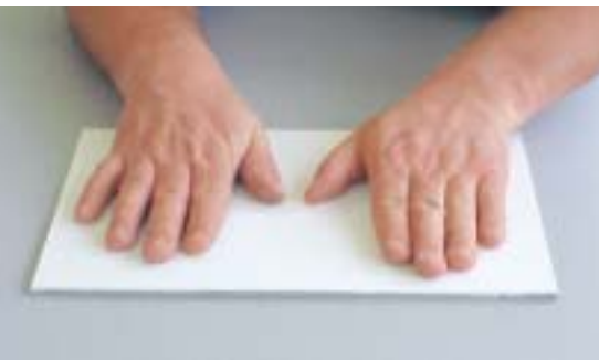
2 «fühlbare Wirkung»

blosses Handauflegen auf diese Flächen gespürt werden, welche Oberfläche sich kalt – und somit schnell Wärme ableitend – und welche sich warm anfühlt. Die mit dem Spezialprodukt gestrichene Wandfläche vermindert somit auch das Kondensationsrisiko (Bild 2).