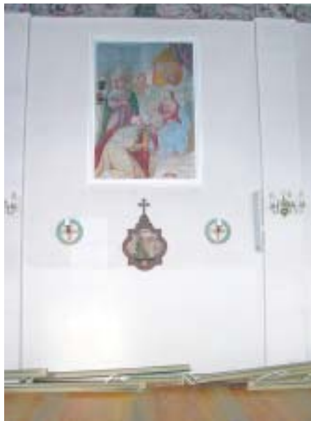
3 Kirche in Schmitten: Schmutz- und Schimmelbefall im oberen Wandbereich

Die Restauratoren wählten bei der Innenraum-Renovation einen Leimfarbenanstrich. Schon nach wenigen Wochen waren erneut dunkle Verfärbungen im oberen Wandbereich feststellbar. Bauphysikalisch ist die Sachlage klar: In den kühlen Jahreszeiten wird die Kirche beheizt, und die erwärmte feuchte Luft kondensiert teilweise an den kalten massiven Aussenwänden. Anhand umfangreicher Messungen und Untersuchungen stellte man später fest, dass der untere Teil der Kirchenwände