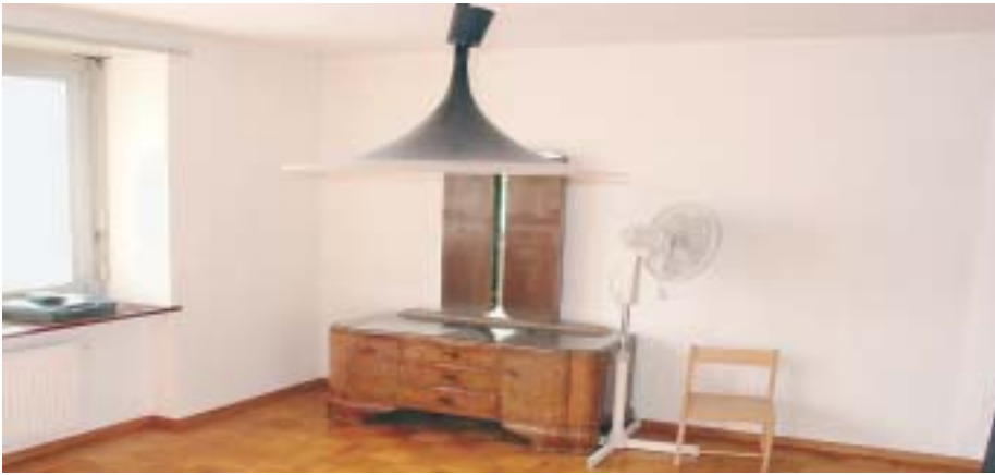
9 Zustand nach der Sanierung

Flecken wurden feinste Staub- und Schmutzpartikel und Schimmelpilz festgestellt.