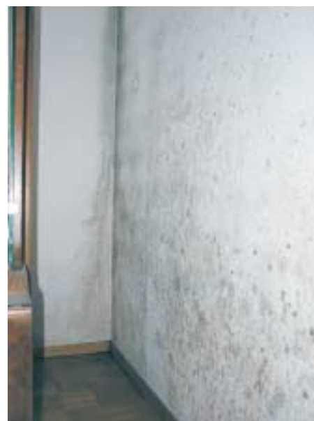
8 Zustand vor der Sanierung

mindert werden, dass wenig Kondensat anfällt und dieses von der wirkstoffhaltigen Spezialfarbe aufgenommen und auch wieder abgegeben werden kann. In diesem extremen Fall müssen aber auch die Lüftungsgewohnheiten radikal geändert werden, ansonsten neue Käl-