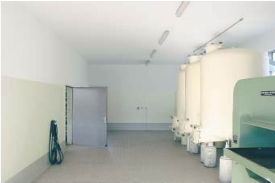
12 Der Gärkeller nach der Sanierung