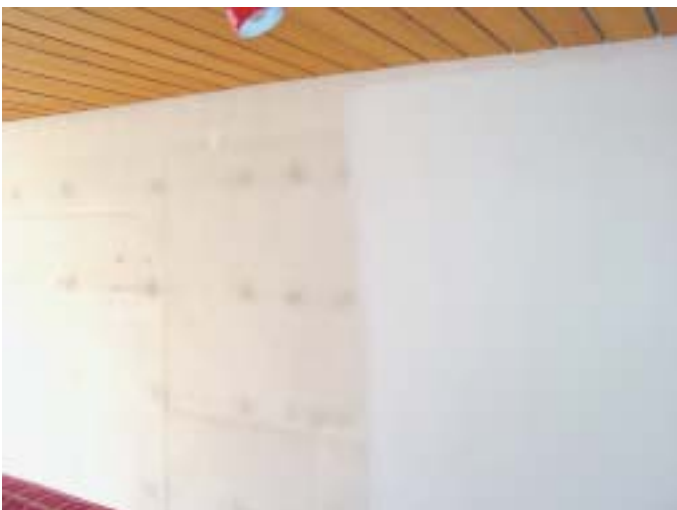
10 Fugen, Stösse und Dübel zeichnen sich ab

Im November wurde das Objekt erstmals begutachtet. Dabei wurde festgestellt, dass im Bereich der Kippfenster auf der Ostseite sich vereinzelt neue Schimmelpilze gebildet hatten. Die Bau-