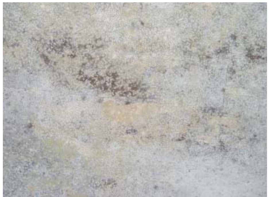
14 Die Decke mit Schimmelpilzfeul