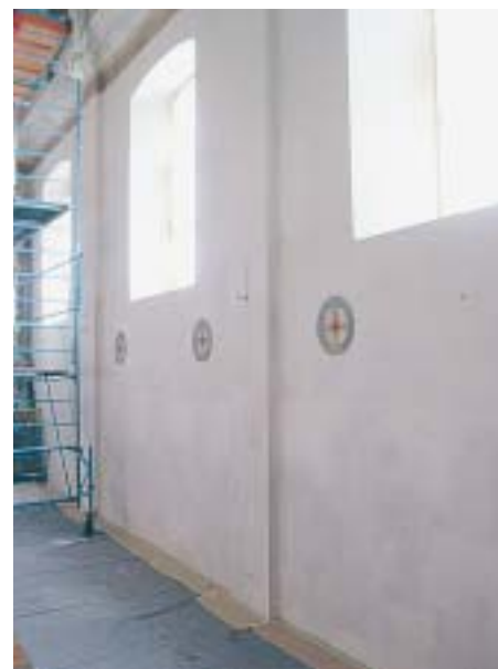
4 Tragfähiger, gereinigter Untergrund, bereits mit Tiefgrund behandelt

Unter dem Motto «manche mögens heiss» wohnt und lebt eine Grossfamilie in einer Churer Altbauwohnung. Die Wohnung ist bei guten 26°C regelmässig überheizt. Die Mutter steht stundenlang vor dem Herd, um die vielen hungrigen