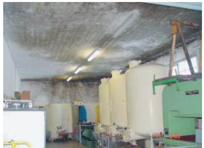
11 Der Gärkeller vor der Schimmelpilzsanierung