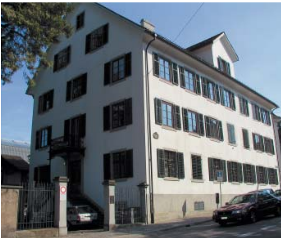
Haus am Hirschengraben in Zürich. Diese historische Fassade wurde im Zuge der Renovation vor acht Jahren mit einem filmbildenden Dispersionsanstrich versehen

Fragen nach den spezifischen Auswirkungen der Alterung von Anstrichen müssen sinnvollerweise genauso Gegenstand permanenter Weiterbildung sein wie das Wissen um neue Produkte oder Applikationsverfahren. Denn eine Alterung ohne Schäden ist möglich, wenn die Alterungs- und Zerfallsprozesse des Materials bekannt und in der Planung berücksichtigt werden können. Dabei gilt aber: Konstruktive Mängel oder Schäden können nie mit einem Anstrich behoben werden, auch wenn von gewissen Produkten geradezu Wunderbares versprochen wird. Weder die Statik noch die Witterung lässt sich durch einen Anstrich austricksen. Auch Mängel in der Ausführung werden durch die Toleranz des Materials nur bedingt und über einen