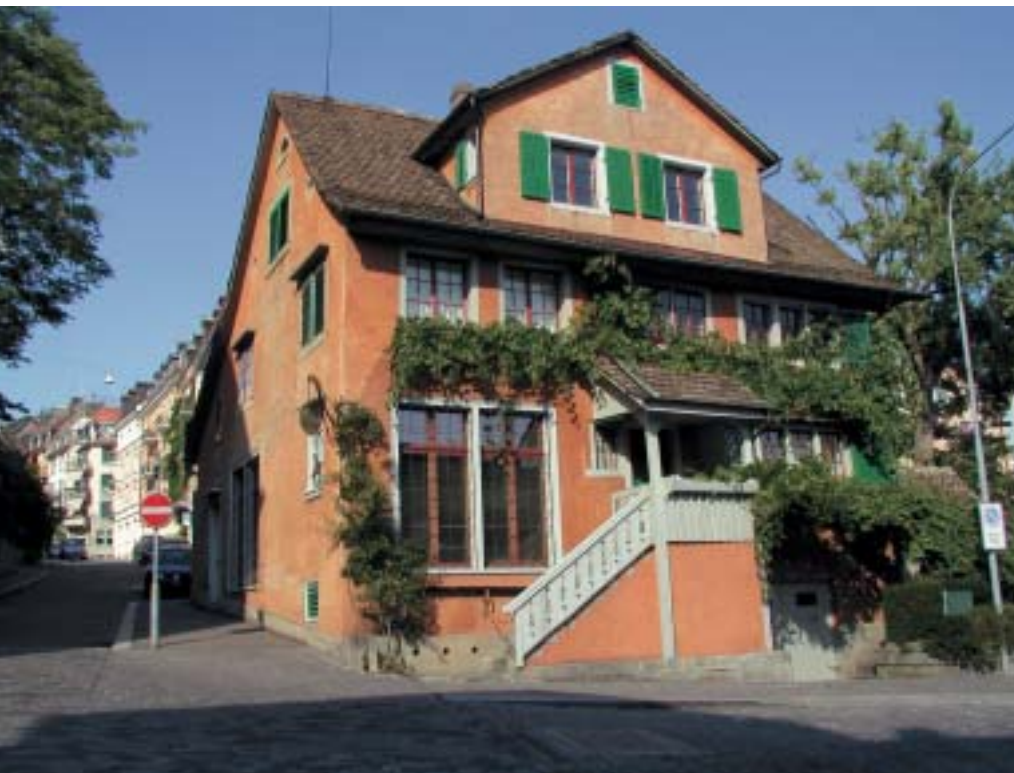
Villa Boissenas am Baschlig-Platz in Zürich. Ein 2-Komponenten-Silikatanstrich auf einem Kalkzementputz von mittlerer Körnung. Der Anstrich ist bereits während über 40 Jahren gealtert – das Haus macht aber keinen desolaten Eindruck

Dies alles vor spannenden, alten Fassaden, die durch ihr changierendes, wolkiges Farbenspiel faszinieren. Während Antipasto und primo Piatto fällt an den Fassaden der «Geschmack» der letzten Generationen auf. An einzelnen Stellen scheu nur noch das Ocker-Gelb der Urgrosseltern, kräftig immer noch das mutige Orange der 70er Jahre. Bereits reichlich attackiert vom immerwährenden Wind und den unbekannt winterlichen Regengüssen leuchtet darüber das gewagte Türkis der Eltern. Geschichte und Geschichten sind bedingt durch den Zerfall und