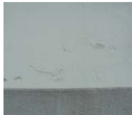
Gealterter filmbildender Anstrich im Detail. Der Anstrich weist Abplatzungen und Blattern auf. Diese Schäden sind typisch für einen filmbildenden Anstrich mit seinen spezifischen chemischen und physikalischen Eigenschaften