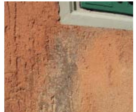
Fassadendetail der Villa Boissenas. Der Anstrich ist deutlich abgewittert, effektive Schäden sind aber keine ersichtlich