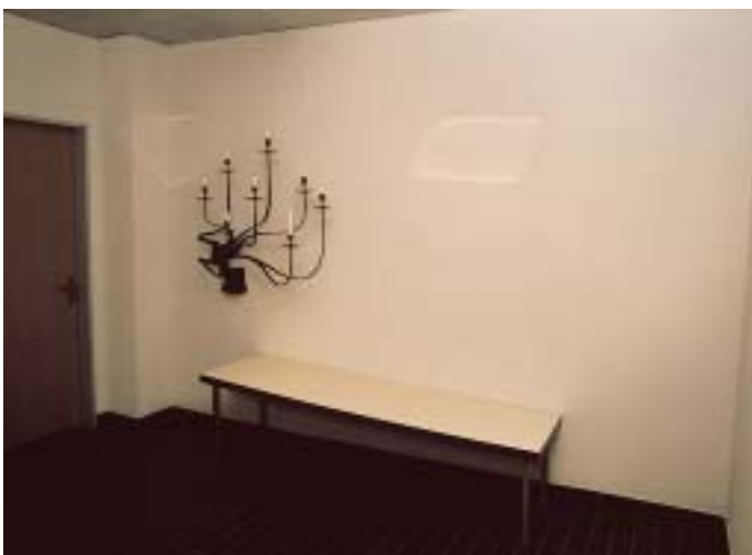
Aufbahrungsraum vor und nach der Gestaltung 1993

Philipp Wyrsch wollte eine persönliche und harmonische Raumsituation schaffen die für alle Religionen Gültigkeit hat. Für die Umsetzung verwendete er verschiedene Materialien. Eine mit Blattgold vergoldete Wand bildet das