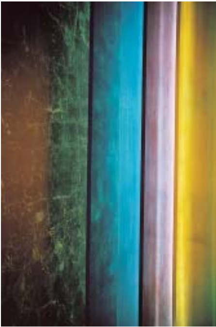
Seitliche Ansicht auf die Plexiglasscheiben