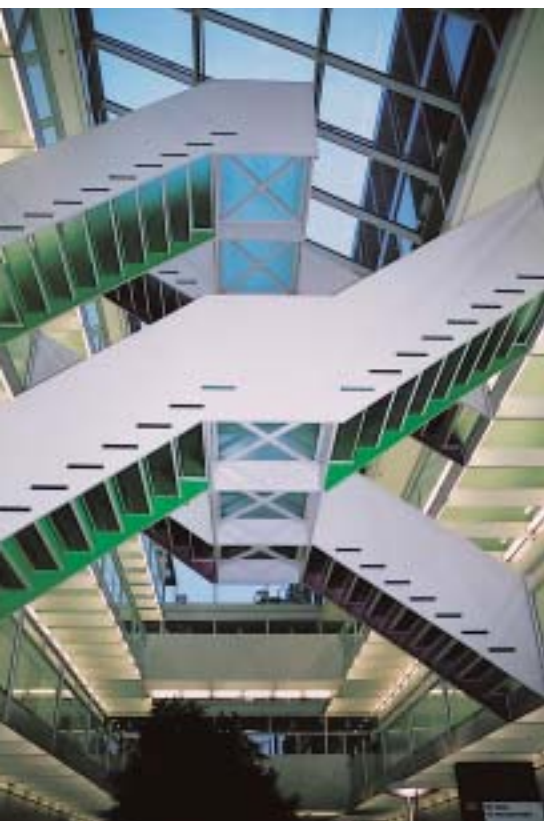
Lichthof im City Bernina mit Passerellen und Treppen

Mit dem vorliegenden Beitrag schliessen wir die sechsteilige Artikelserie zum Thema «Farbgestaltungen zwischen 1990 und 2002 in Zürich» ab, nicht aber das Thema Farbgestaltung als solches. Was und wie die angehenden Farbgestalterinnen und Farbgestalter in ihren Arbeiten betrachtet, reflektiert und kritisiert haben, ist beachtlich. Die Aussicht auf eine Publikation in der Fachzeitschrift applica motivierte die Studierenden im Haus der Farbe wohl zusätzlich zum Verfassen von inhaltlich und sprachlich anspruchsvollen Farbkritiken. Das Redaktionsteam dankt den Farbgestalterinnen und Farbgestaltern für den grossen Einsatz und wünscht ihnen auf dem beruflichen Weg farbige Perspektiven.