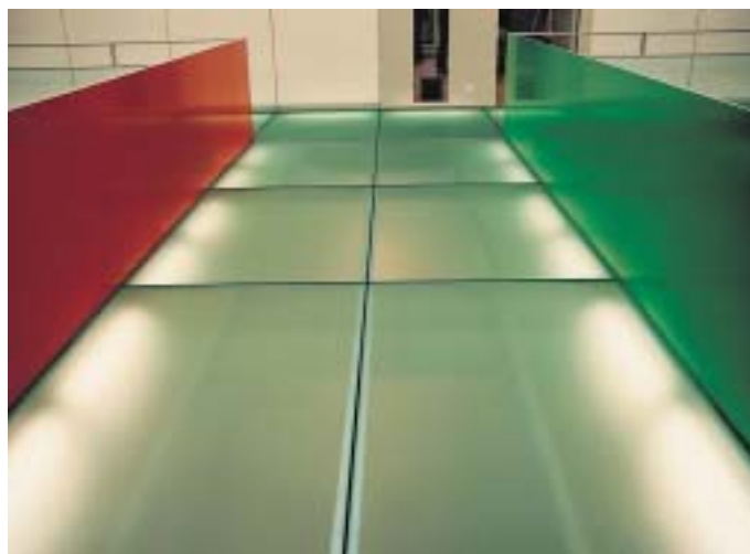
Lichteffect im Passerellenbereich

Distanz betrachtet, ergänzen sich diese verschiedenen Einzelbilder zu einem neuen Gesamtbild.