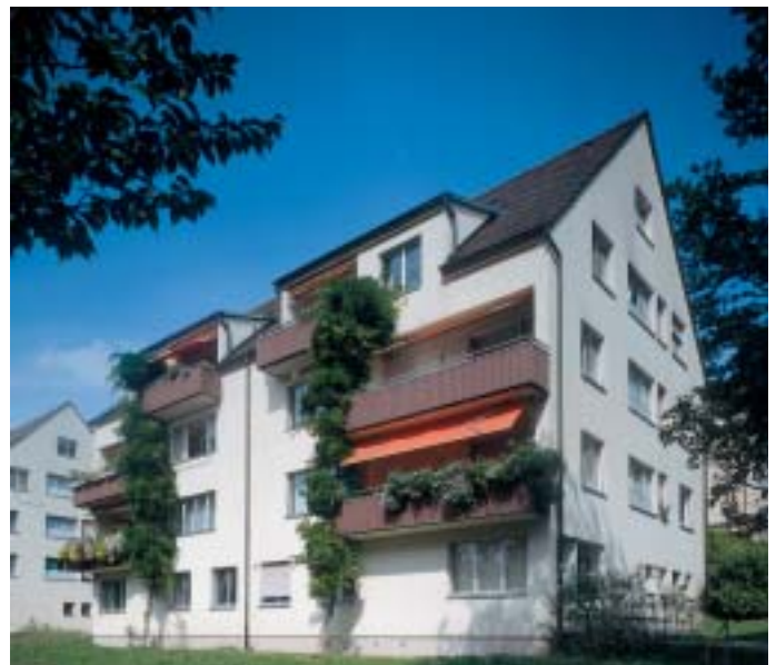
... in den 70er Jahren ...