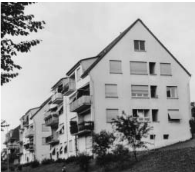
Die Genossenschaftshäuser in den 30er Jahren...

Die Herstellung von Polystyrol-Hartschaum geht auf das Jahr 1930 zurück. Seither war man bestrebt, Polystyrol in Form von Schaumstoff herzustellen. Dies gelang erst rund 20 Jahre später. In einem chemischen Prozess, der so genannten Polymerisation, lagern sich die Styrol-Moleküle kettenförmig aneinander. Dabei entsteht der Werkstoff