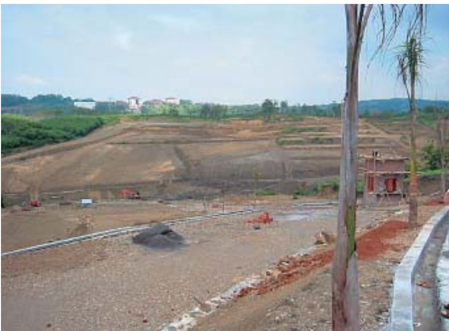
Der Urwald wird abgeholzt, Terrassen werden geplant

Unser Quartier liegt an einer Hanglage, bei der die engen Gässchen und Strässchen enormen Steigungen ausgesetzt sind. Auf der Abdeckung des Hügels sind Hunderte von kleinen Häuschen und Baracken angesiedelt, mit