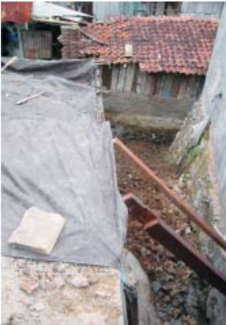
Fundamente sind nicht verankert, Haus ist abgestürzt