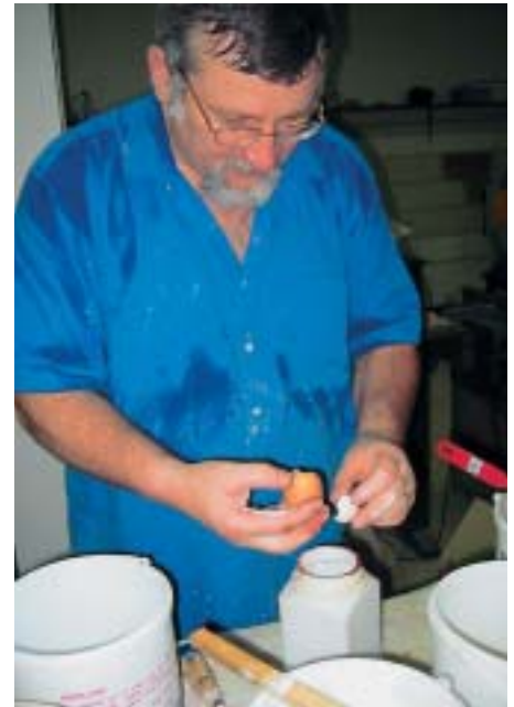
Herstellen von Eitempera bei fast 40 Grad Hitze und bei 98 Prozent Luftfeuchtigkeit