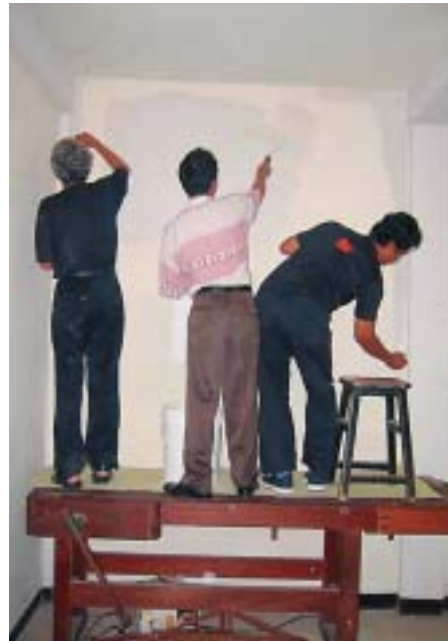
Malerarbeiten auf Indonesisch