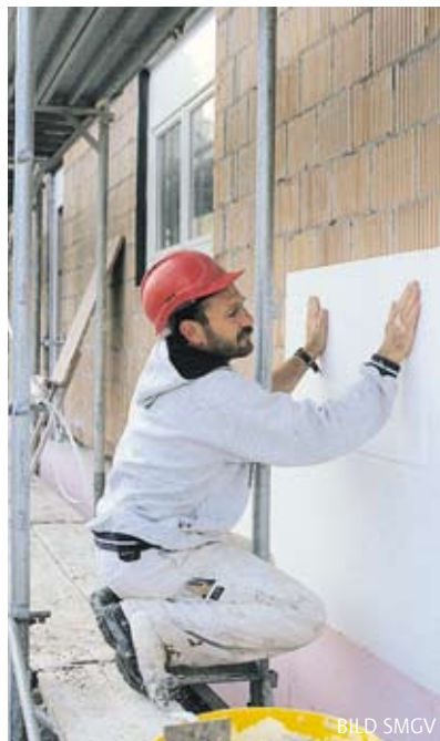
Gute Fassadendämmung – beim Neubau ein Muss.

Eine attraktive Hausfassade ist eine Visitenkarte. Tag für Tag muss diese Aussenhaut jedoch verschiedensten Witterungseinflüssen trotzen, ist sie doch Eis und Schlag-