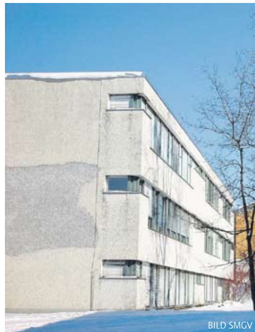
Schäden an der Fassade können viele Ursachen haben.