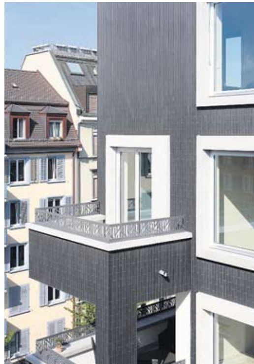
Als hinterlüftetes Fassadensystem eignet sich z.B. die «StoVerotec» Fassade als Lösung bei Neubau und Sanierungen.

Weitere Fachinformationen: www.bau-schlau.ch www.malergipser.com